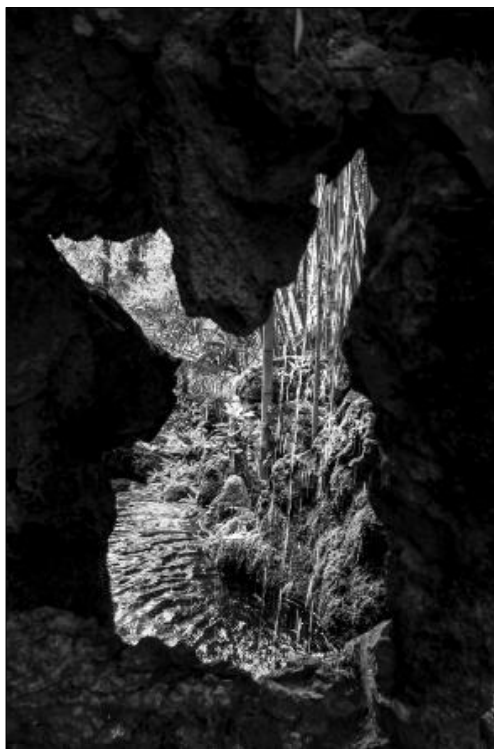
Millor col·lecció i premi per votació popular: «Regalimant», de Jordi Gironès