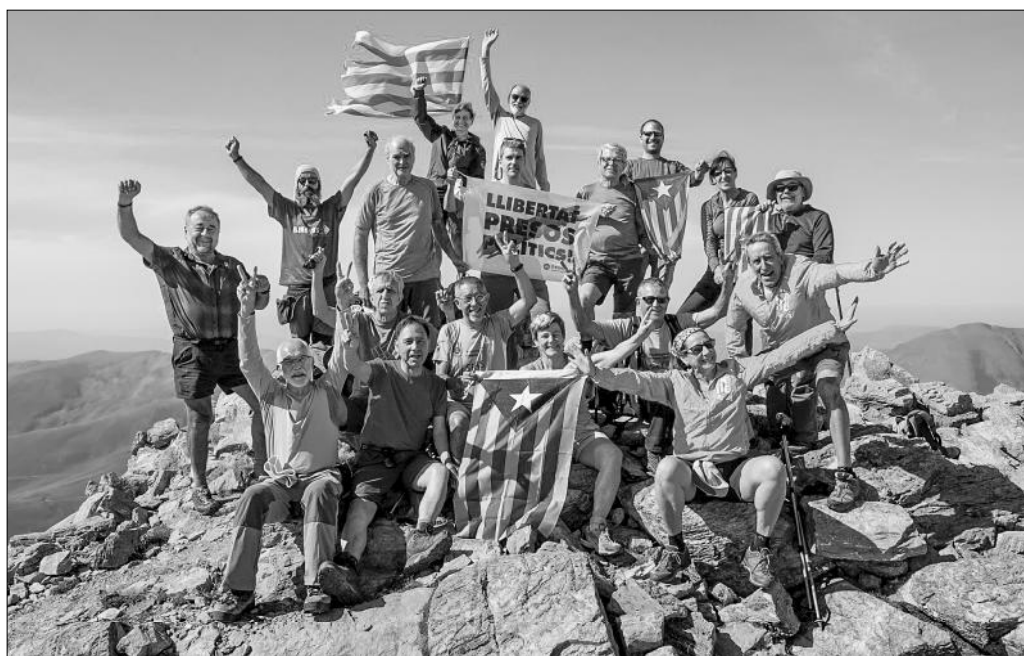
Sortida de Veterans al cim del Montsent de Pallars (2.883 m).