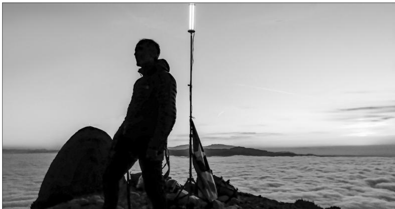
Llum i Llibertat. Alba a l'agulla de la Prenyada.