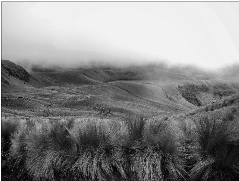
Segon premi: «Boira al 'Pajonal'», de Xavier Bardají