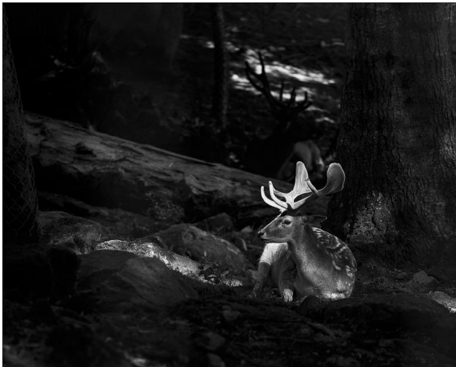
Primer premi: «Meditant», de Jordi Huerta