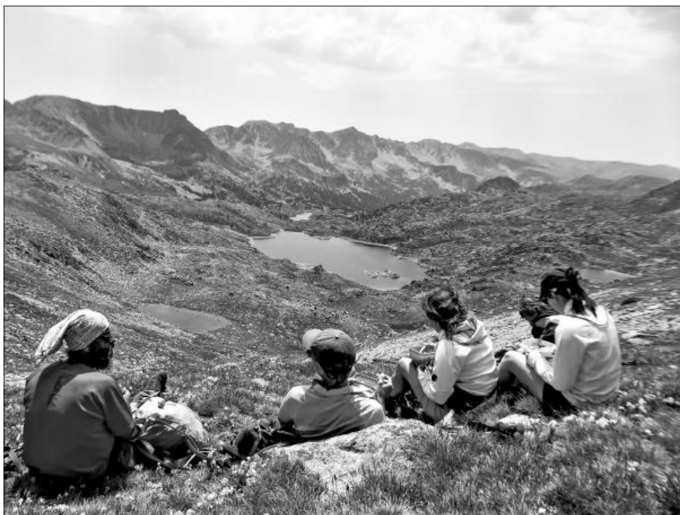
Premi a la millor fotografia feta en excursions de la SEAS: «Recés», d'Albert Cortès