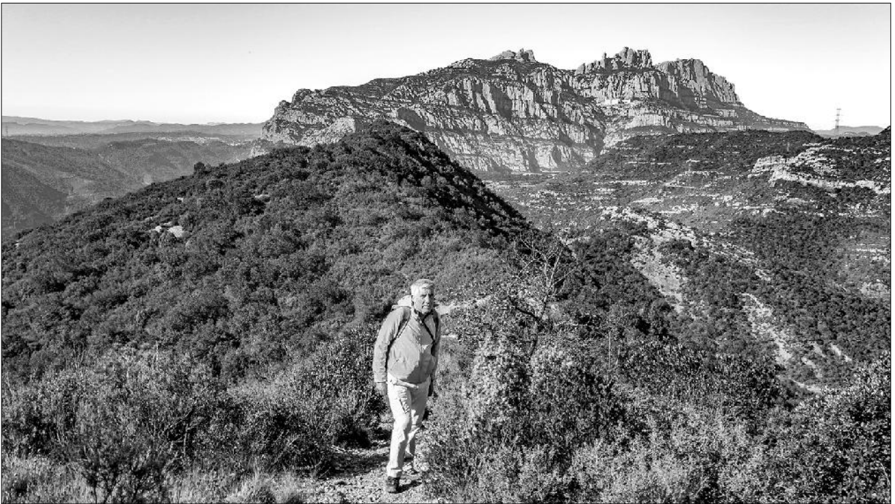
Sant Salvador de les Espases i al fons Montserrat.

— Efectivament, aquesta pràctica respon a aquest plantejament, però això ja havia passat a l'escalada, que ha evolucionat de les grans parets a l'esportiva i al córrer, que cada cop cerca més circuits segurs.