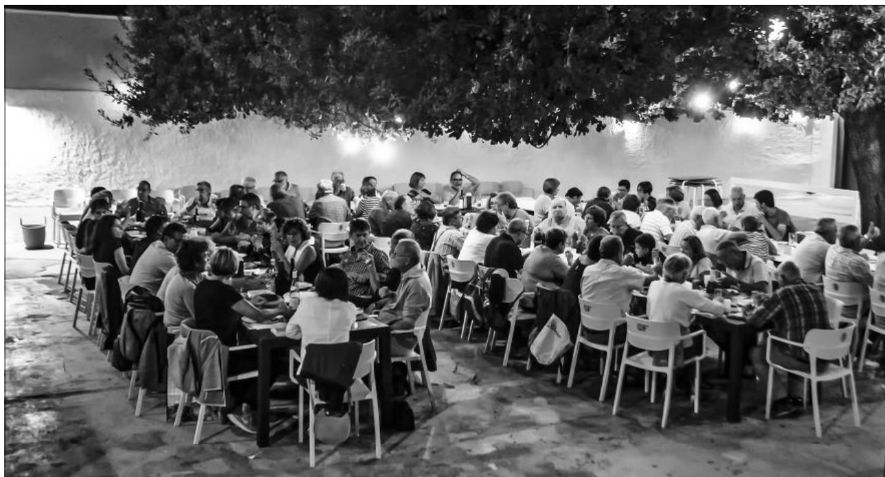
Sopar de motxilla al pati del Roure.