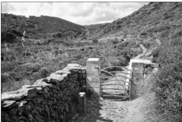
Una del centenar de portes-barreres.

A la fi de la dècada de 1980, es va iniciar una campanya popular per a la defensa del Camí de Cavalls pels seus valors patrimonials, històrics i paisatgístics, que duria a l'obertura de l'expedient per a declarar-lo Bé d'Interès Cultural. L'ús del camí ha generat conflicte entre els propietaris i els caminaires, car molts trams passen per propietat privada i no sempre reconeixen el dret d'accés a les seves finques. El 21 de desembre de l'any 2000, el Parlament de les Illes Balears va aprovar la Llei del Camí de Cavalls, que hi és considerat com «una realitat històrica i cultural del poble de Menorca» i té com a objectiu «establir un pas públic, establert sobre el traçat original del Camí de Cavalls, amb l'objecte de permetre el seu ús general, lliure i gratuït». Posteriorment, el Pla especial va establir el seu recorregut i ha possibilitat els convenis i les expropiacions, ja que travessa cent vint finques privades. Des de l'any 2010, després del seu condicionament i marcatge, ja se'n pot gaudir a peu, en bicicleta o a cavall.