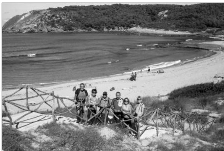
Platja des Tancat a la Cala d'Algaiarens.

rar el degradat de colors des del blau marí intens passant pel blau turquesa i verd fins a un amarronat vermellós causat per les terres vermelloses de l'entorn i del fons marí de la cala. Avui el dia és magnífic, blau cel amb algun nuvolet d'evolució, no hi ha tramuntana i conseqüentment la mar està més calmada que ahir. L'horitzó sembla marcat amb tiralínies, la definició és tal que el celeste i el marí sembla que no es puguin fondre. Deixem la Cala del Pilar i arribem al Macar 2 d'Alfurinet, pel camí hem trobat panells indicadors amb mapes, indicacions, consells i prohibicions, algunes curioses: «prohibit fer les necessitats fisiològiques a les dunes i al bosc»... Com deia, arribem al Macar d'Alfurinet, cala plena de còdols, pedres arrodonides de mides d'entre 3 i 20 cm. En aquest punt del camí, deixem la costa i seguim per camins i pistes interiors, primer per bosc de pins i alzines i més endavant ens trobem que voregem camps de conreu i boscos d'alzines fins a arribar a la platja del Tancat dins de la Cala d'Algaiarens, final de la 7a etapa. Són les 14 h, el mar calmat, l'aigua transparent i encara tèbia, sol i bona temperatura, sens dubte un bany ens anirà d'allò més bé abans de dinar i de trobar-nos de nou amb la Ma Teresa i el