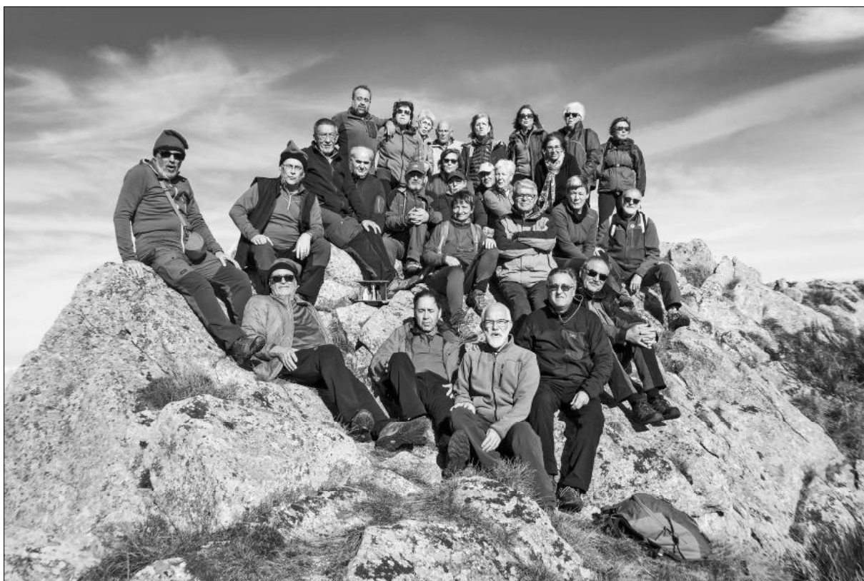
Com ja és tradició, aquest any la SEAS ha posat el pessebre al cim de Roc Comptador, massís de les Salines, Alt Empordà.