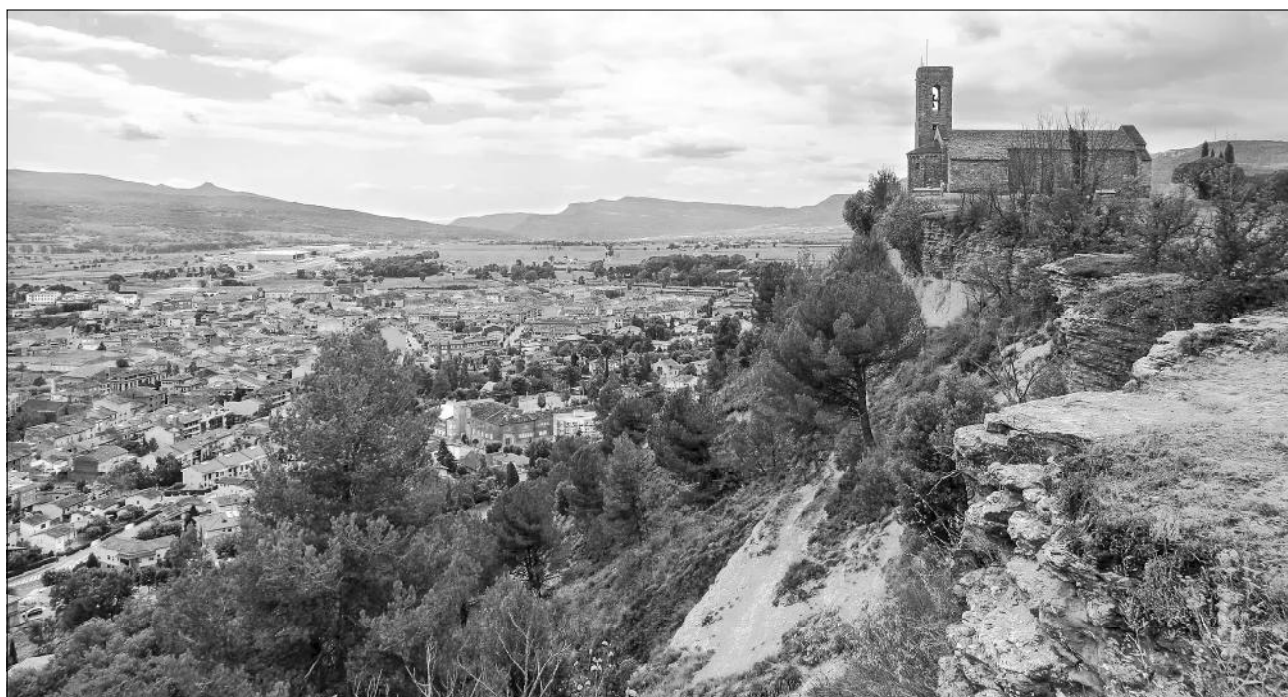
Castell de Tona.

Torre de defensa. Caminant pel pla arribem a la torre d'uns 9 m d'alçada, cons-