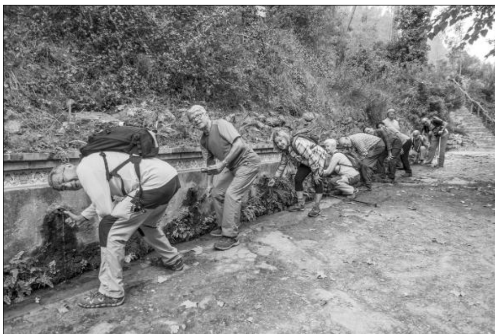
Font de les Dous, matinal al Clapí Vell, Alt Penedès.