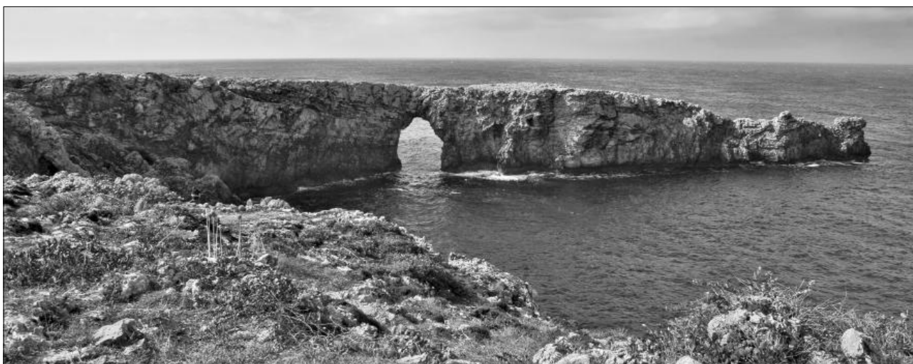
El Pont d'en Gil.

sa. Les parets internes solen ser recobertes d'una barreja de calç, sorra, òxid de ferro, argila vermella i resina de llentiscle, per impedir filtracions i la putrefacció de l'aigua que conté. Durant molt de temps ha estat l'única font d'aigua potable en moltes localitats, com Capri, on posteriorment va ser complementada amb la importació d'aigua des de la península italiana. També es va convertir en l'única forma d'abastir barris sencers, com va passar en l'època musulmana a l'emblemàtic barri de l'Albaicín de Granada; construccions que encara segueixen en ús.