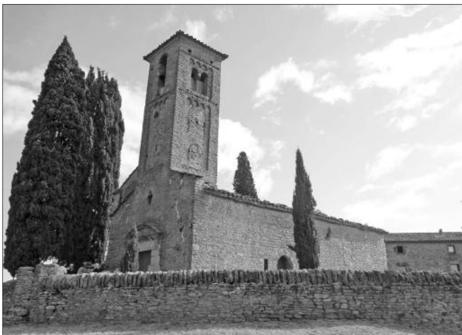
Sant Jaume de Viladrover.

El carrer de seguida es converteix en una pista planera que serpenteja pels camps fins a arribar a Sant Jaume de Viladrover. Parròquia que aglutina el nucli de població dispersa de l'oest del