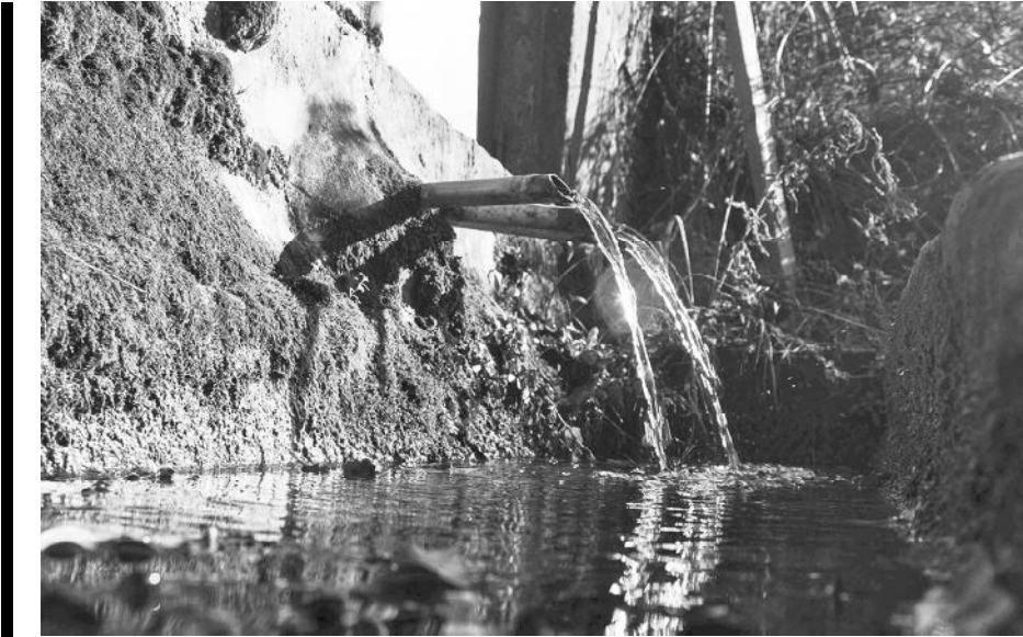
Font de la Serra.

terme municipal del Brull. Es tracta d'un territori pla, amb predomini de l'agricultura i on l'església mil·lenària sembla posada al millor lloc per presidir els camps. Aquesta posició aglutinadora del nucli de cases disperses es manifesta a l'aplec que se celebra anualment el diumenge de Pasqua Florida des de 1932 amb gran assistència popular. Disposa de campanar de tres pisos que descansa sobre la volta a l'extrem oest de la nau. Al mur de ponent es pot veure la porta oberta al segle XVII i una finestra en forma de creu. L'absis, reconstruït a inicis segle XX amb molta tècnica i rigor estètic, presenta dents de serra i arcuacions llombardes perfectament imitades.