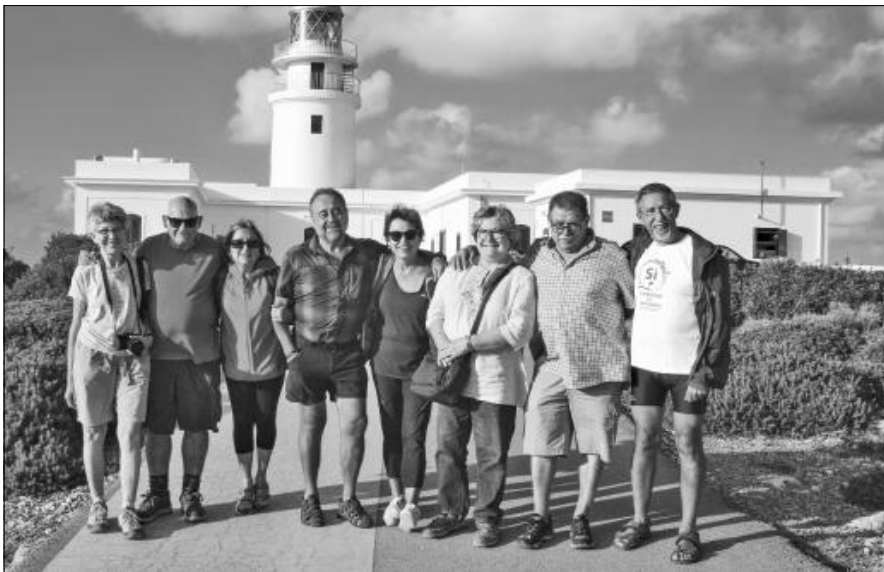
Tot el grup al Cap de Cavalleria.

Aquest escrit ha estat possible gràcies a les vivències, moments, paisatges admirats i trepitjats i per sobre de tot a la companyonia i savoir faire de tots durant els set dies de convivència. Gràcies a les fotos de la Teresa, l'Àngels, l'Albert i les meves, sense elles no podríem revivre aquelles estones.