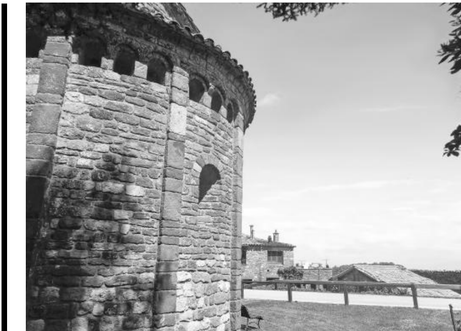
Detall de l'absis de Sant Martí del Brull.

Just davant tenim les restes del castell del Brull, domini dels vescomtes d'Osona-Cardona i possessió dels comtes de Barcelona. Queden poques restes d'aquest castell, sembla que tenia planta pentagonal amb cantonades amb torres de planta circular. El que visitem és l'angle nord-est de la fortificació on és visible una torre que va quedar recoberta per una construcció posteriorment quan es va reforçar la fortificació. Des d'aquí s'albira espectacular la pujada fins a Collformic, i el majestuós Matagalls al fons.