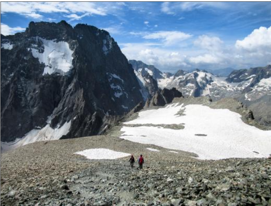
Descens cap al coll de la Temple.

de la cresta. L'esforç de la pujada i l'altura es fan notar, alentint el nostre pas i transformant la travessia en un esgotador exercici d'equilibrisse. Quan arribem de nou al coll, respirem alleujats. Ja només queda flanquejar la gelera, tornar pel polsegós camí fins al refugi i, des d'aquí, passejar de tornada fins al poble. Després de 12 hores de camí, arribem esgotats però contents al poble, ja que hem gaudit d'una preciosa excursió i ens espera una freda i refrescant cervesa per celebrar-ho.