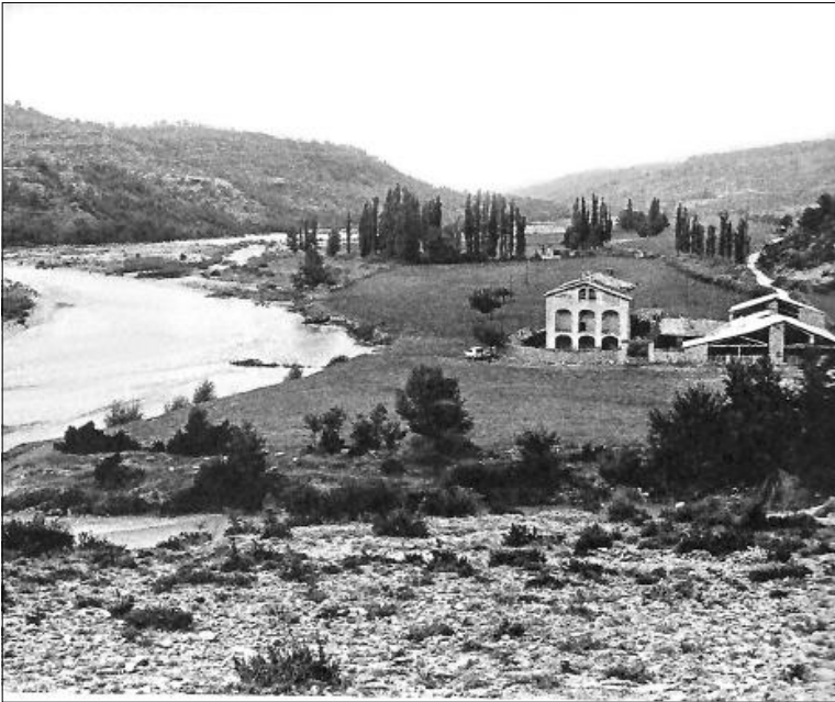
Masia Mont-rebei, avui coberta per les aigües de l'embassament de Canelles.

de sobte es comença a tancar i es passa per llocs on el riu està encaixonat amb una amplada de 10 a 12 metres on s'obre pas l'estret camí treballat dins de la roca, el qual va ser obert per la Mancomunitat de Catalunya l'any 1924. Des del camí, la Noguera Ribagorçana es fa mirar amb respecte i una certa por. El 1977, amb l'augment de la capacitat de l'embassament de Canelles, el camí que estem fent va quedar cobert per les aigües. El novembre del 1982 s'inaugura el camí actual excavat a la roca, 30 metres més amunt de l'anterior, amb l'ajuda d'ENHER. Sortint del congost, agafem direcció a la masia de Carlets (751) i collet de la Pertusa (665); se'ns ha fet fosc (el 6 d'octubre havíem endarrerit una hora el rellotge per primera vegada després del nou canvi horari). De cop i volta sentim un tret i a la poca estona comencem a veure unes taques de sang per la pista que ens porta a Corçà, i ens preguntem si algú s'ha fet mal i decidim