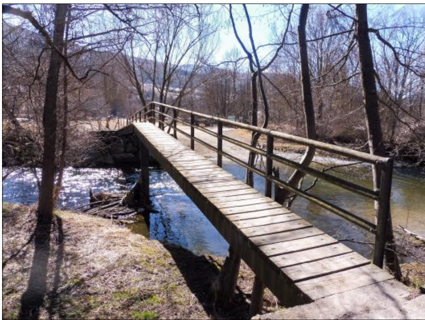
La passarel·la de Queixans, la Cerdanya.

I més proper a la natura és encara el pas, un indret per on es pot creuar el riu perquè el cabal ho permet i el fons és prou estable. Passar a gual era encara molt habitual unes poques generacions enrere. I encara una versió més elaborada és el gual consolidat, fet normalment d'una plataforma de formigó damunt d'uns tubs foradats per on s'escola l'aigua quan el cabal és petit, i vet aquí que al llarg del Segre se'n troben uns quants. Els guals, però, tenen una diferència fonamental respecte els ponts i les palanques: en aquests darrers, l'aigua sempre ha de passar per sota, a no ser que hi hagi aiguats d'un cabal extraordinari que poden emportar-se-les, i també pot passar en algun pont, com ha succeït al llarg de la història del riu; els guals, en