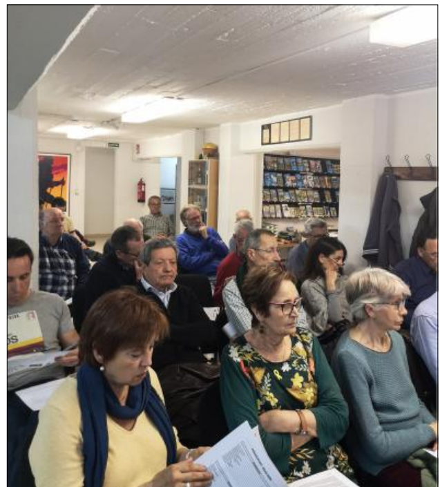
Assemblea de la SEAS 2020.

— S'ha comprat a l'editorial l'Alpina els mapes digitals calibrats de Catalunya interior-litoral, i també es decideix comprar els del Pirineu Català-Andorra i els del Pirineu Aragonès-Navarrès.