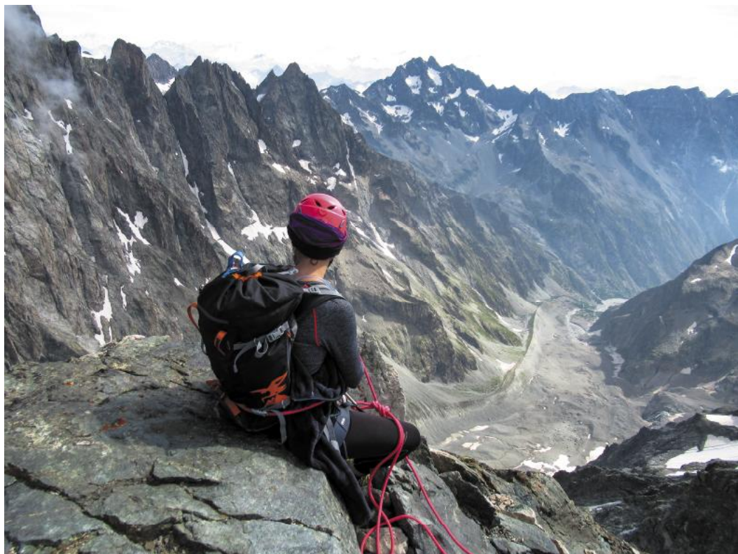
Vistes des del cim del Pic Coolidge, al massís dels Écrins, Alps francesos.