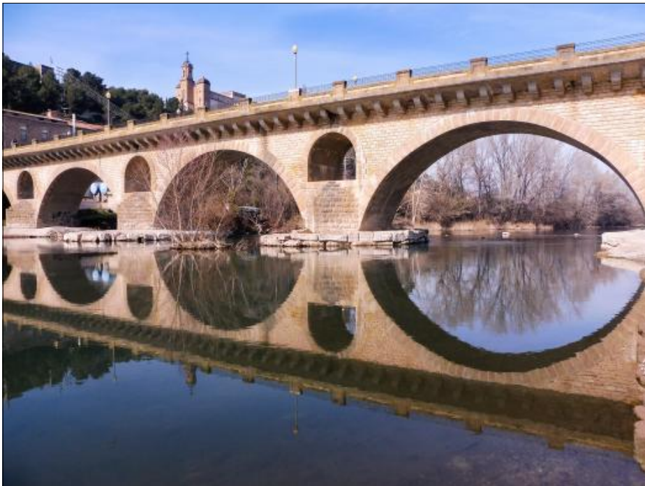
El pont de Sant Miquel, Balaguer, la Noguera. Totes les fotos són de l'autor.