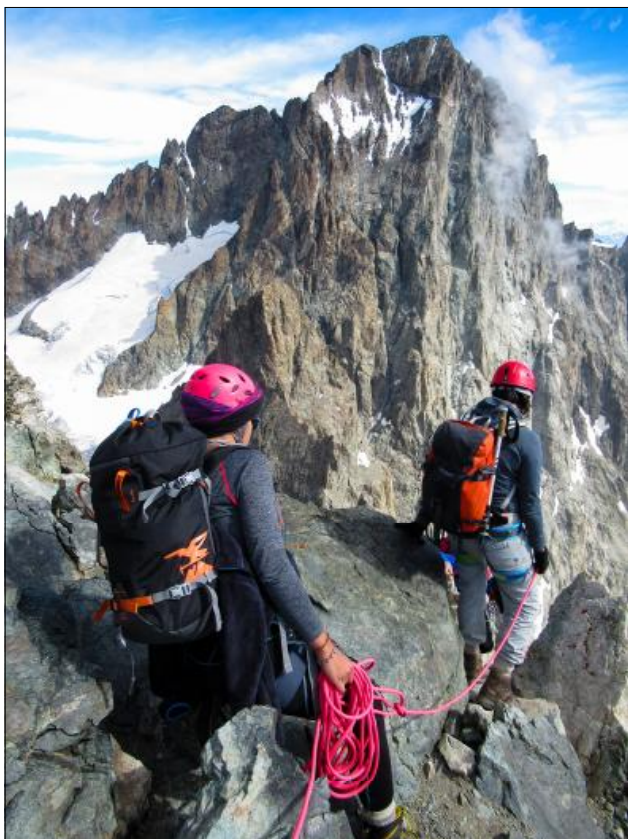
Últims passos delicats abans del cim (al fons, el cim de la Barre des Écrins.

de 1.600 metres d'altitud que porta directament al cim del pic més alt de la zona, la Barre des Écrins, de 4.100 metres d'altitud, que a hores d'ara s'amaga rere els núvols. Aprofitem les hores mortes per practicar amb la corda, descansar i xerrar amb les altres persones del refugi. Demà ens espera un dia molt llarg i exigent.