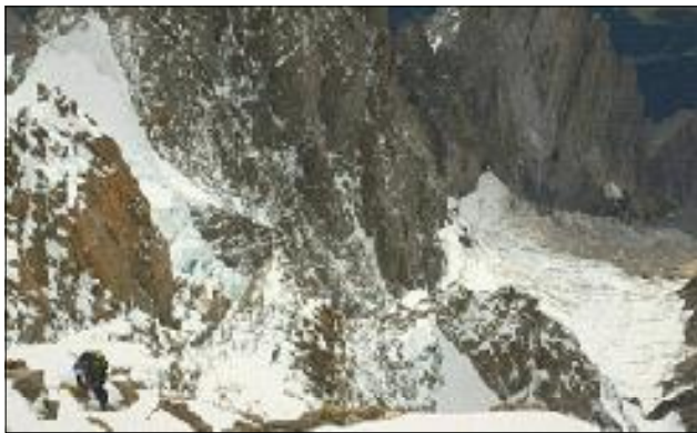
Remuntant després de creuar la gran canal. Al fons la gelera de Frêne.

Així vam remuntar uns centenars de metres pel costat est de l'aresta de Brouillard, fins que vam superar les últimes roques i vam trobar-nos amb una àmplia rampa de neu bastant dreta que anava a buscar el fil de l'aresta.