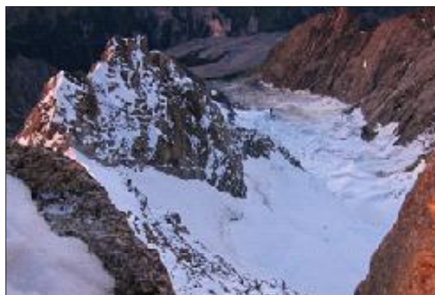
Accés al coll d'Eccles per la part superior de la gelera de Brouillard.

Amb la llum que feia el frontal no hi veia gaire més enllà d'on ell era. Aquells