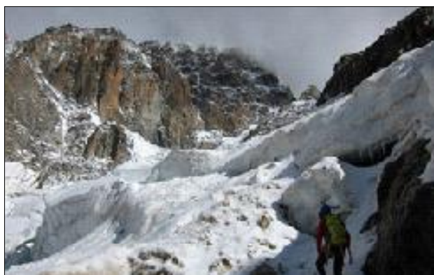
Part superior de la gelera i la paret per on creua la via, pilastres de Brouillard i pic Eccles.

Estàvem sols. De fet ho havíem estat tot el dia, des que havíem deixat el refugi Monzino després d'esmorzar. Vam arribar al bivac a quarts de dues remuntant la gelera de Brouillard, la qual, per cert, vaig trobar més caòtica que mai.