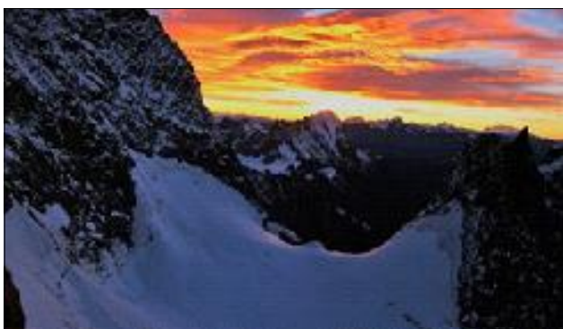
El Coll de Peuterey 3.900 m amb les primeres llums del dia.

fegava i renegava. Des de sota, amb tot el cos en tensió d'observar-lo, veia com sortien espurnes pel fregament del ferro dels seus grampons contra la roca. Més amunt d'on ell era, hi havia una baga que penjava d'un pitó, a la llum del frontal la veia de color clar i semblava molt esfilagarsada. No donava cap confiança, però ell s'hi va agafar i li va aguantar. Quan va vèncer el pas i va ser dalt em va dir que pugés. Vaig pensar que, segurament, salvat aquell pas no trobaríem res més de tanta dificultat. Li vaig demanar que mantingués tibada la corda i vaig agafar-me amb mans i puntes dels grampons al bo i millor que vaig trobar. Mica en mica vaig progressar fins a la seva posició.