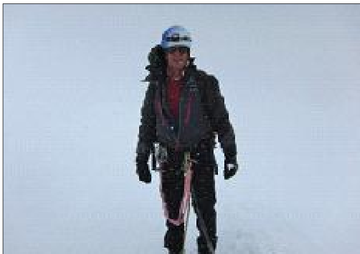
Sense visibilitat dalt del cim del Mont Blanc 4.810 m.

L'apatia produïda per l'esgotament no em va deixar expressar el que segurament hauria fet qualsevol en el moment d'assolir la fita somiada durant anys, no hi va haver cap salt ni crit d'alegria, però vaig ser conscient del que volia dir aquell cop «som dalt del Mont Blanc». Ja havia fet el Mont Blanc altres vegades, però mai hi havia pujat per l'aresta de la Innominata. Aquell cop ho havíem aconseguit!