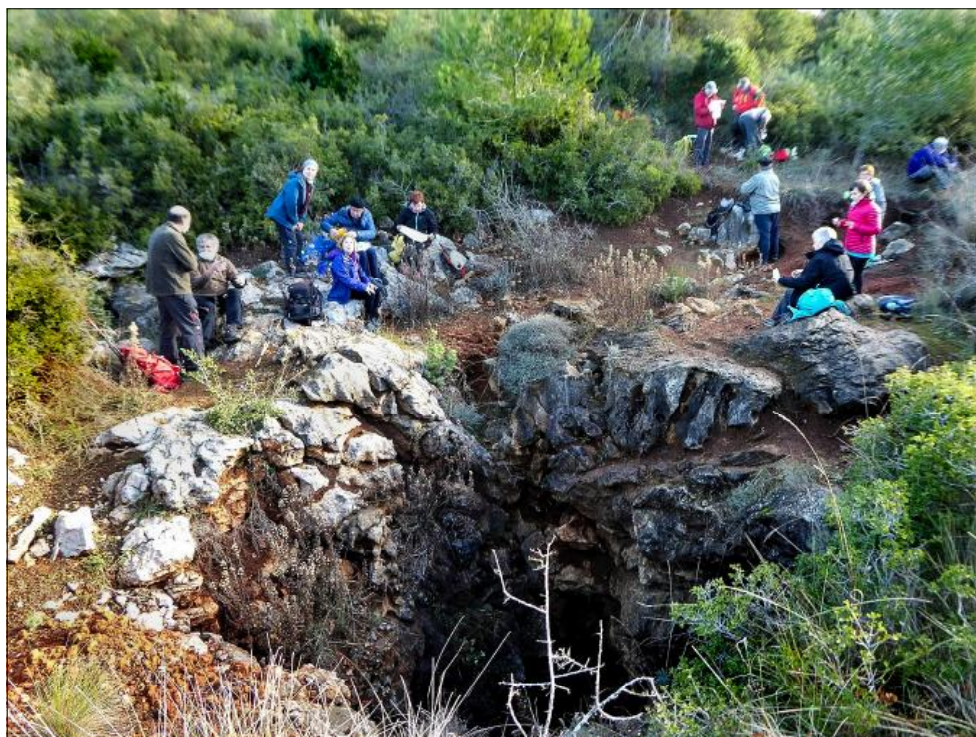
Matinal a Can Sadurní, avencs i dolines (Muntanyes d'Ordal). Esmorzant a l'Avenc gran de les Alzines.

20/12/2020 - Itinerari circular amb 19 assistents i començament a la masia de can Sadurní, avenc de Can Sadurní, dolina i avencs de les Alzines, barraca d'Ardenya, dolmen d'Ardenya, camí medieval de Vallirana a Begues, avenc Petit de Can Figueres i acabant a la masia de can Sadurní. No es va poder fer la visita guiada a la cova de Can Sadurní.