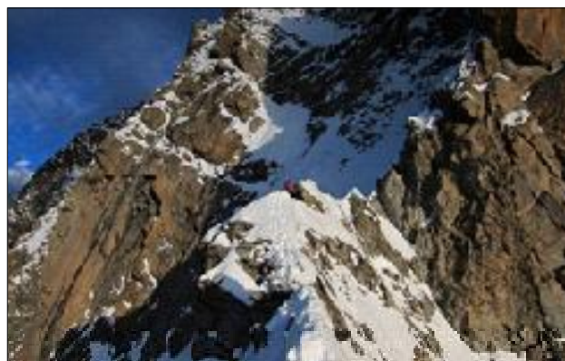
Tram central de la paret amb la gran canal.

Mentre assegurava al Jordi i veia com avançava pas a pas lateralment amb