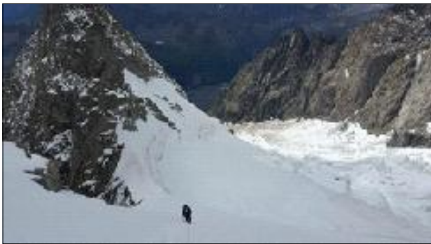
Camí del bivac Eccles, per sobre del coll de Frêne. Vista del pic Innominata i gelera de Brouillard.

Era la desena temporada que demanava al Jordi d'anar a fer aquella via al Mont Blanc. De fet tan sols l'haviem arribat a intentar en quatre ocasions ja que en la seva majoria, o bé el mal temps o bé les condicions de la muntanya, ens van obligar a canviar els plans. En dues ocasions havíem acabat allí mateix, als bivacs Eccles. Les altres dues havíem desistit després de deixar el refugi Monzino.