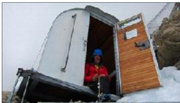
Exterior del nou (del 2011) refugi-bivac Giuseppe Lampugnani, altrament anomenat bivac Eccles, 3.860 m.

Dins aquella petita cambra la foscor era total, el silenci opressiu i la gelor t'abraçava. Tot era quietud, cap soroll, tan sols la respiració relaxada del Jordi. Ell hauria