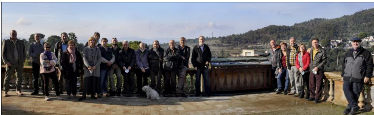
Membres de la SEAS al costat de la Balconada Fulgenci Baños.

La SEAS i el poble de Sant Just Desvern van complir amb el seu deure: honrar un prohom de casa i deixar-ne memòria perenne, perquè sigui exemple de vida per tots els que ara hi som i per als que vindran.