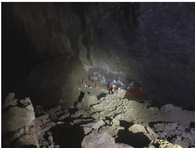
Sala del Vivac (-500 m).