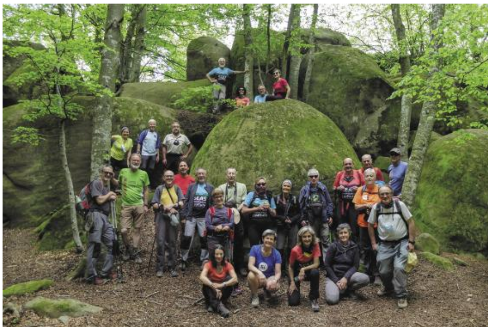
Excursió a la vall d'Hostoles (Garrotxa). Foto de grup a les Roques Encantades.