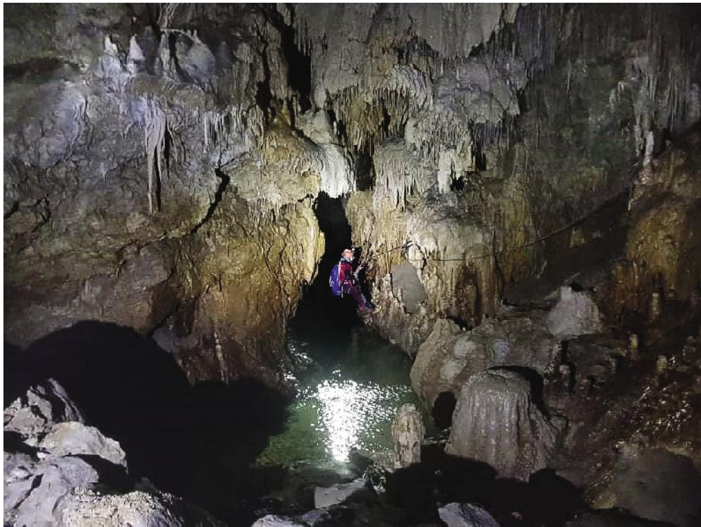
Zona activa del sistema amb el riu subterrani (-750 m).

Ens hidratem i alimentem per a la dura tornada que ens espera.