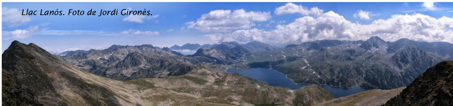
Llac Lanós.