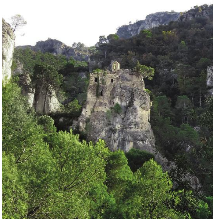
L'ermita de Sant Simeó Estilita o de la Columna des del camí de Tivenys al balneari.

amortització de Mendizábal, tot i que des de 1866 fins a 1967, època de funcionament de l'antic monestir de Sant Hilari com a balneari, l'ermita va tenir una certa revifalla.