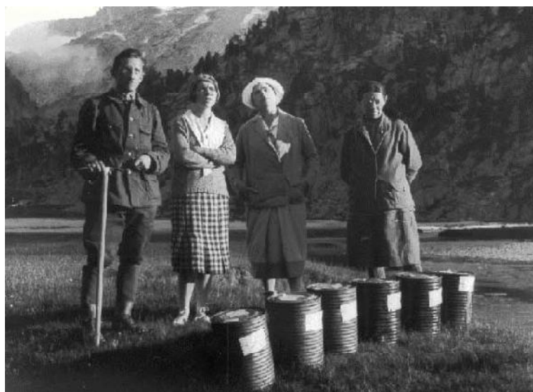
Norbert Casteret amb els 6 bidons de fluoresceïna i els components de l'expedició.

La caravana que el 19 de juliol de 1931 travessà el port de Benasc camí dels Aigualluts era ben peculiar, estava formada per ell, la seva dona, la seva mare (Esther Casteret) i dues amigues de la seva dona, a més d'un contrabandista que els guiava a ells i a la mula que traginava els 6 bidons de 10 kg cada un tapats amb la lona d'una tenda. D'aquesta manera esperaven passar com un grup que anava d'excursió si es topaven amb els gendarmes o la guàrdia civil. No van trobar a ningú, el contrabandista controlava perfectament la zona. Van arribar a lloc a les 14h, el contrabandista va descarregar els bidons, va cobrar i se'n va anar, ells van esperar fins al capvespre per abocar els bidons al Forat d'Aigualluts. A mitja nit l'aigua del fons encara era verda, però a les quatre de la matinada ja no en quedava ni rastre. Llavors van fer dos equips, un amb la seva dona i les amigues seguirien el riu Éssera vigilant totes les fonts