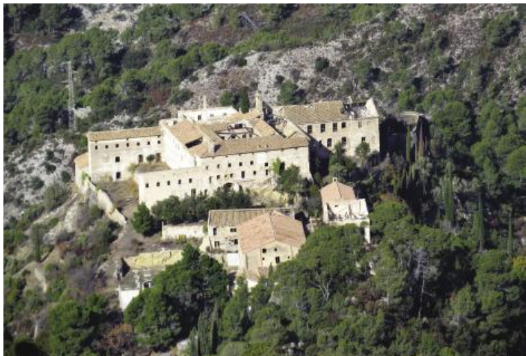
Vista del conjunt monàstic de Cardó, reconvertit en balneari l'any 1866 i abandonat en l'actualitat.

Novament l'excusa del repte dels 100 cims ens ha servit per gaudir d'una bonica caminada per indrets meravellosos i poc freqüentats. La fita era pujar al cim del Xàquera, també anomenat Creu de Santos, que amb els seus 942 m suposa el punt culminant de la Ribera d'Ebre.