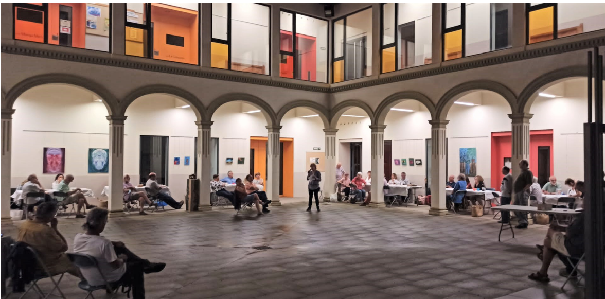
Sopar de Motxilla 2021 al pati de Les Escoles.