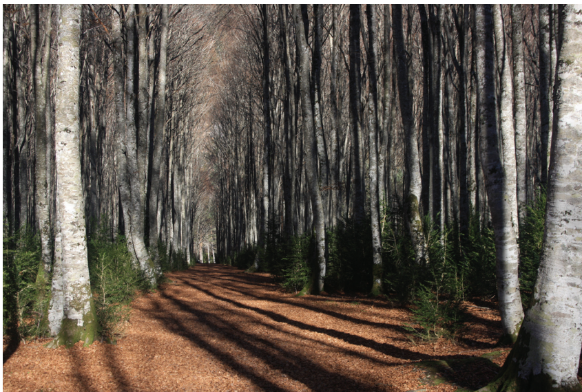
Premi a la millor foto per votació popular «Camí», de Núria Palomar