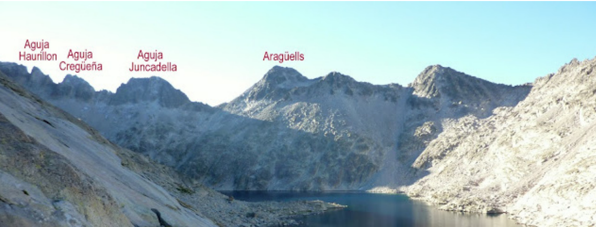
Llac de Cregüeña i cresta de Cregüeña amb les agulles: Juncadella, Cregüeña i Haurillon.

1990. Quan el Govern d'Aragó, l'any 2017, va decidir canviar els noms d'alguns pics del Pirineu, no va canviar el nom de l'agulla Juncadella, perquè era el nom del pirineista que la va coronar per primera vegada.