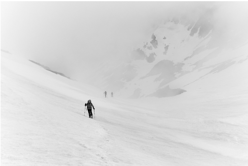
Segon premi: «Boira», de Carles Serraima