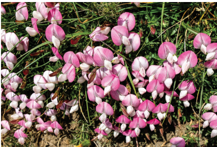
Ononis cristata (Gavó alpí).

I és en aquest punt on ens separem més els uns dels altres ja que cadascú pren el