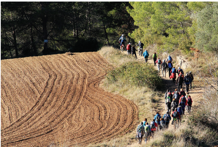
Premi a la millor foto en excursions SEAS «Seguint les roderes», de Domingo Padró