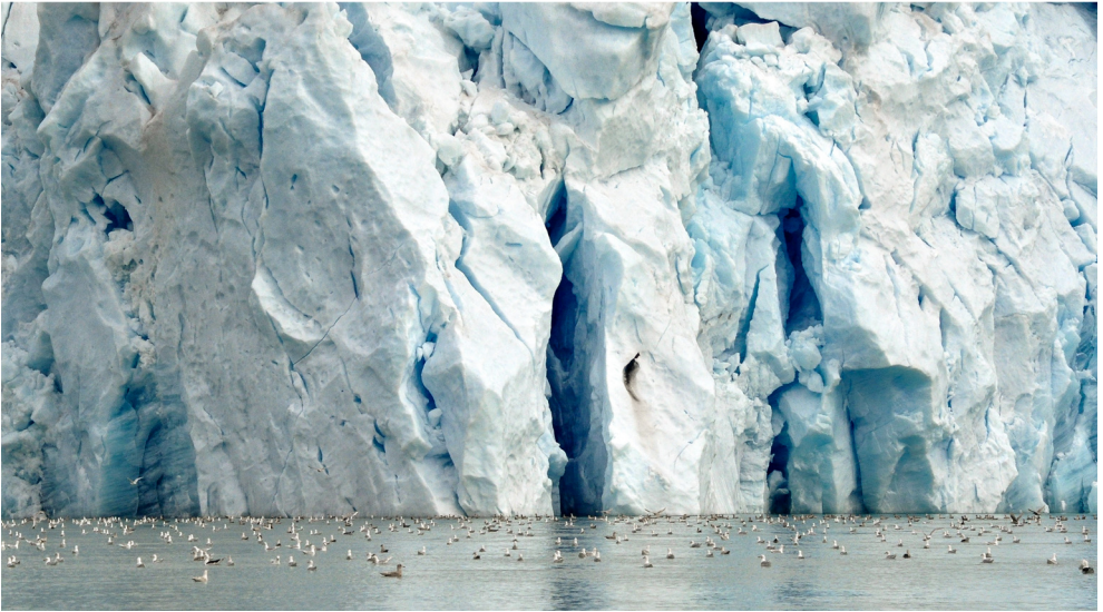
Primer premi: «Clima, Col·lapse», de Leonci Canals