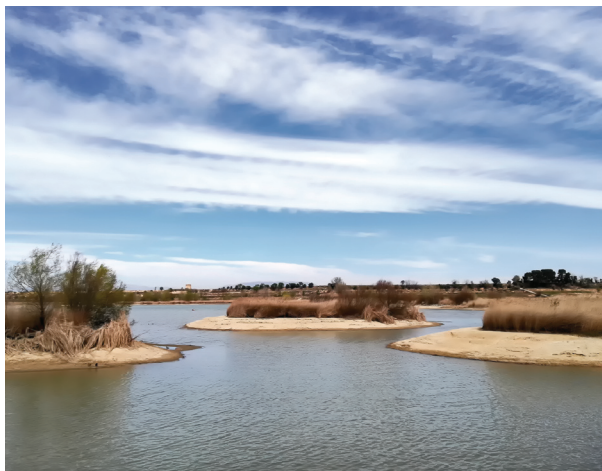
Illots dins l'estany.

Una data clau fou l'any 1853 amb l'arribada de l'aigua del riu Segre a les comarques de Lleida a través del canal d'Urgell. L'aigua dolça va transformar la vida al voltant de l'estany i als pobles agrícoles de la plana de Lleida. Aviat hi augmentaria la població: dels 14.000 habitants a l'any 1887 passà als 24.000 l'any 1920. S'afavorí la caça d'aus aquàtiques i la pesca de l'anguila. S'hi organitzaren curses de natació. S'hi celebraren casaments i alifares (festa del darrer dia de batre). I es posava en marxa un incipient turisme rural.