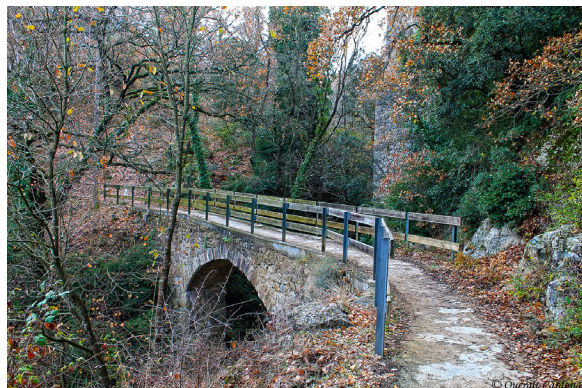
Indret del Tramvia de Sang.