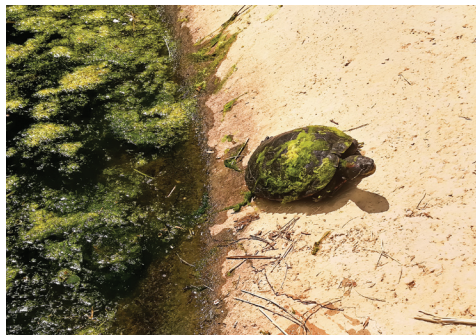
Tortuga de l'Estany (Emys orbicularis).

Hi podem veure els insectes, com ara els mosquits i els sabaters, que caminen