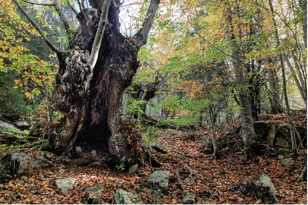
Caminant entre castanyers. Fotos de Jordi Gironès.

Després de molts anys d'anar recorrent a peu muntanyes i indrets, arribes a un punt de creure't que tens un ampli domini dels racons més emblemàtics del nostre país fins que un dia et sorprens quan «descobreixes» una contrada per on sempre havies passat a prop sense haver-t'hi endinsat mai. I això és el que em va passar tot just fa un any, el 29 d'octubre de 2019, quan vaig proposar a uns companys de pujar al coll d'Àligues des de l'ermita de l'Erola —situada a mig camí entre Viladrau i Sant Segimon— remuntant el torrent de l'Erola.