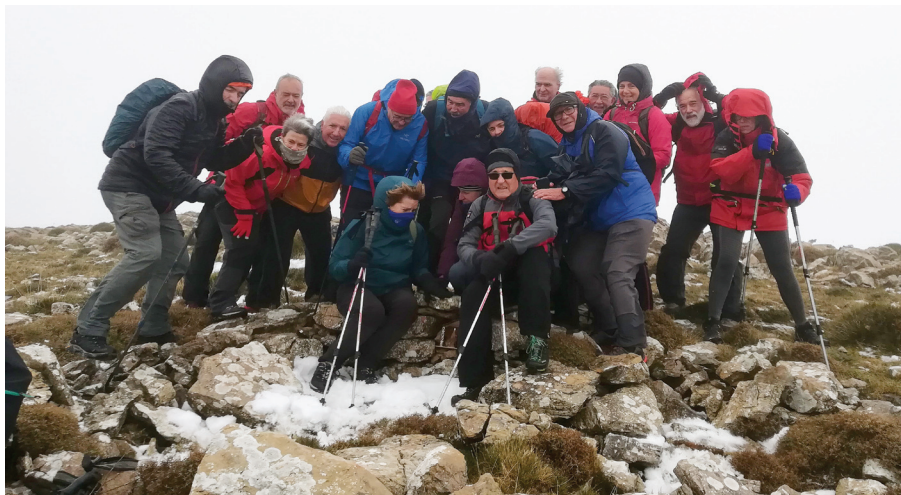
Foto de grup al cim de la Tosseta Rasa, on es va col·locar el pessebre enmig d'una forta ventada.