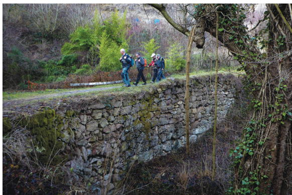
Trams del GR-270 que coincideixen amb el Tramvia de Sang.