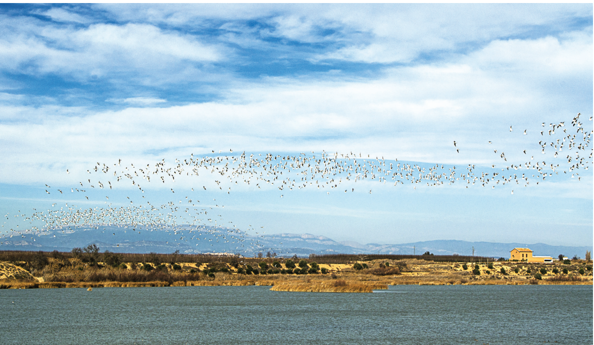
Estany d'Ivars.