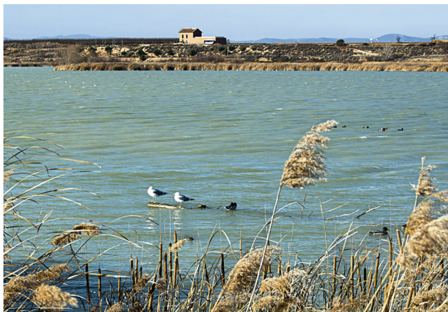
Gavines i ànecs a l'estany d'Ivars. Masia cal Sinén al darrere.

Amb vistes cap al nord. Montpedró, congost de Mont-rebei, Mont-roig, Montsec d'Ares, serra Carbonera i Montsec de Rúbies.