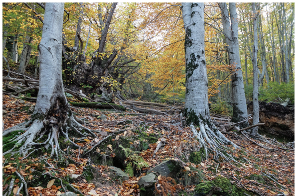
Caminant entre castanyers i faigs.

Track: https://ca.wikiloc.com/rutes-senderisme/gruptibi-2020-10-29-viladrau-torrent-de-lerola-59640772