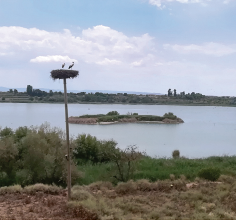
Niu de Cigonyes.

L'any 1948, en plena dictadura de Franco, es va assecar l'estany. L'empresa Locomoción y Transportes SA, favorable al règim, va aprofitar la Ley de Desecación y Saneamiento de lagunas, marismas y terrenos pantanosos de 1918 que requalificava les terres per a ús agrícola, i va drenar les aigües a un afluent del riu Corb, en contra de la voluntat popular.