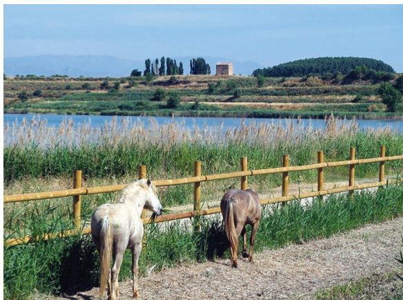
Cavalls pasturant al canyissar.

L'entorn de l'estany està envoltat per zones de conreu de regadiu. De les 438 hectàrees de l'espai natural protegit, 271 són parcel·les agrícoles que pertanyen a desenes de propietaris diferents. Els cultius més habituals són cereals (blat, ordi i panís), fruiters (pomeres i pereres) i farratges. Aquestes parcel·les configuren un mosaic paisatgístic de gran bellesa i són un hàbitat clau per a moltes espècies de fauna.