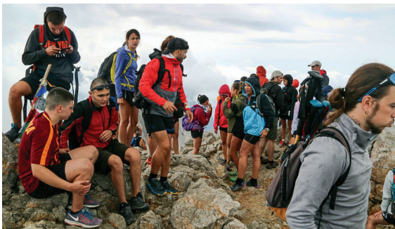
Imatge del cim del Pedraforca publicada al web naciodigital.cat el 13 de juliol de 2020

Fa temps que volia anar a la fageda de la Grevolosa (Osona), un lloc que poca gent coneixia amb un ambient certament màgic. Doncs bé, ja no té res de desconegut pel gran públic! Arribo al pla de la Vola i la feina és trobar lloc per aparcar. Ho aconseguim i ens enfilem cap a Sant Nazari a partir d'on em poso a la cua per circular pel corriol que puja a la part central més bonica del bosc amb exemplars de magnífics faigs. És una autèntica «festa» amb una gentada que busca ansiosament on fer la foto de grup. Quins temps aquells quan podia recrear-me trobant el millor faig per fer la foto amb els nens! Després de fer aquesta petita excursió, decidim anar a la Garrotxa per completar el dia i en passar per la collada de Bracons veiem un espectacle dantesca amb una immensa quantitat de cotxes aparcats a les vores de la carretera complicant la circulació d'altres cotxes. On es deuen ficar tots els ocupants? Doncs us