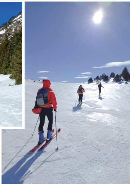
Foto de la dreta. Circ de Comporells, pujant al cim del Petit Peric, esquí de muntanya.

Foto superior. Vall de Galba, pujant a la bar-raca de la Jaça de la Llosa amb raquetes de neu.