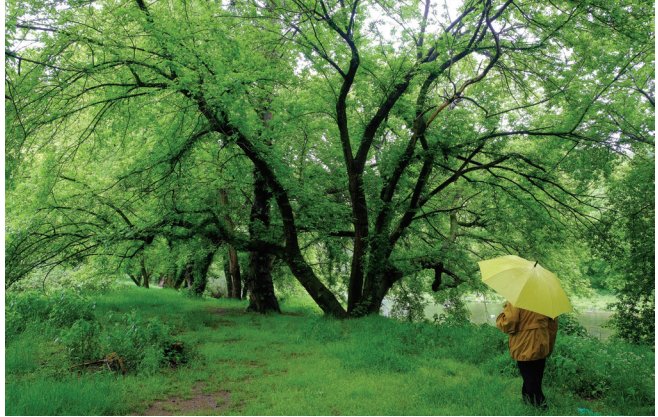
Un dels atractius de la pluja es fer-nos copsar sentors que altrament no ens arribarien.

Perquè una sortida tingui glamur també és determinant escollir bé la data de la seva realització. No és el mateix moure's per terres d'ametllers quan els arbres estan florits que en l'època del marçiment de les fulles. Estarem d'acord que les fagedes tenen predicació quan es tornen del color de l'aram, però el calendari dels pins negres o de les estepes es té en compte? O el de quan a les suredes els llevaires arrenquen les pannes? O el de quan arriben a muntanya les ramades? Són exemples al vol. Naturalment, són reflexions que no tenen sentit si ens posem en mans del primer track que ens arriba i el seguim a ulls clucs.