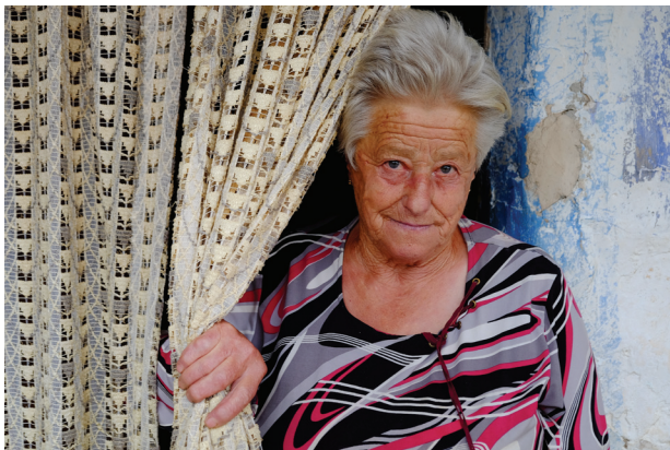
Tenim en compte que la cultura pagesa està desapareixent amb els darrers estadants de les masoveries?

Fer fotos. Les acabo d'esmentar, les fotos. Se'n fan a tort i a dret, compulsivament. Poques, però, deuen arribar a bon port: triades, arxivades, documentades. Recordar a quin lloc correspon allò que hi surt deu ser difícil perquè són imatges fruit d'una reacció evanescent. Molt al contrari les recordarem si han estat pensades, mesurades, estudiades. Un bon company és un trípode, un estri que semblaria antiquat i que ajuda a disposar de la calma necessària, a enquadrar amb precisió, a tenir el camp focal que ens cal per a cada situació. Això sí,