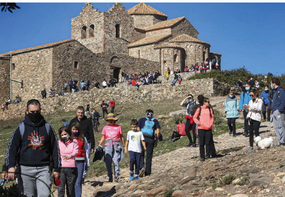
La Mola de Sant Llorenç de Munt. Foto publicada el 20 d'octubre de 2020 al diari El País.