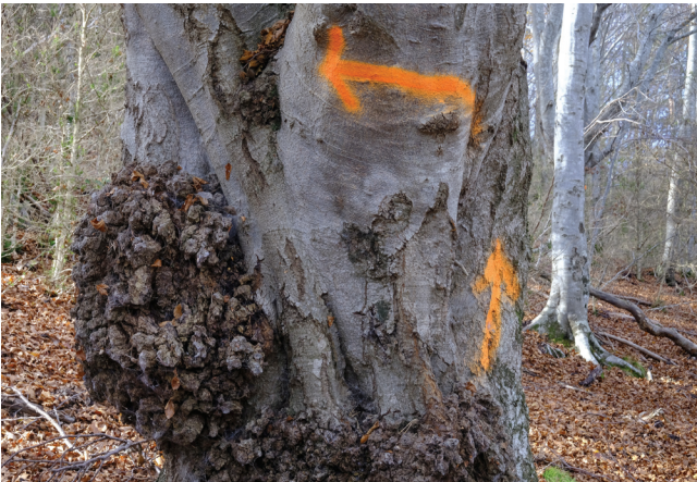
Fa mal d'ulls veure una senyalització barroera damunt d'un element a respectar.

Distàncies i noms. Segons com, als rètols indicadors s'hi posa la distància, una dada que l'excursionista agraeix. Si no la troba és fàcil dir-se: "per anar al punt indicat ja lleigeixo per on va el camí; però hi tinc cinc minuts, una hora?" Sí, és òptim proporcionar aquesta informació servint-se del temps. És molt diferent transitar per damunt d'un terreny de mala petja que per un vial plàcid, de la mateixa manera que canvia molt haver-nos d'enfilars amb penes i treballs o anar planejant. Tot això ho reflecteix admirablement bé el temps, sempre que aquest sigui el real. Ho dic perquè de vegades inclou les parades, cosa que no té sentit si no sabem el temps que aquestes representen. Que els quilòmetres poden ser complementaris, no cal dubtar-ne.