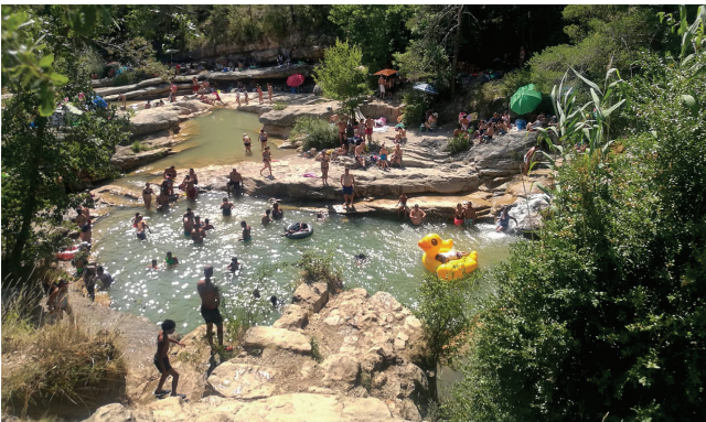
La riera de Merlès a l'estiu del 2020.

Aquests són alguns indrets on he patit més recentment, sobretot en caps de setmana, el vertiginós augment de gent a la muntanya, molt més accentuat a partir de l'esclat de la pandèmia de la Covid-19.