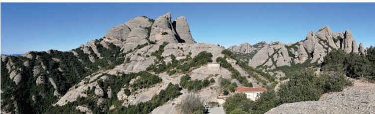
Panoràmica de la Mirinda de Santa Magdalena i les Gorres. A la dreta: la Prenyada, l'Elefant i la Mòmia.

27/03/2022 -Excursió circular amb sortida des del coll del Bruc passant per l'ermita de Sant Miquel de Vilaclara, el pont Foradat, la font del Ferro, la cova de Can Llucià, la balma de Can Soteres i retorn al punt d'inici, amb 11 assistents.