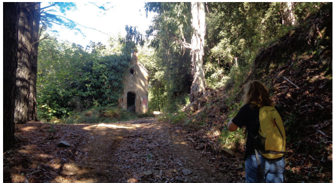
Ermita de la Mare de Déu del Part.

2,5 km. Tornem al camí Ral, i continuem ascendint. Ara que ja som a més altitud,