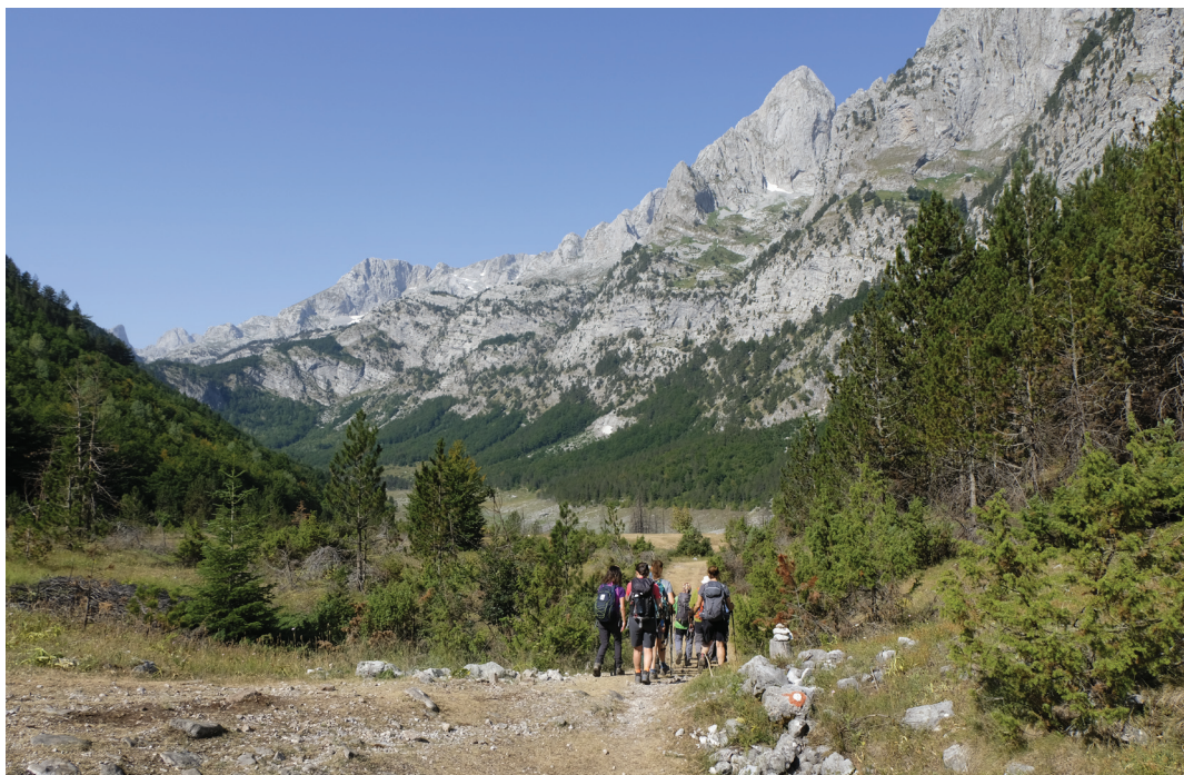
Vall de Ropjana, Albània.