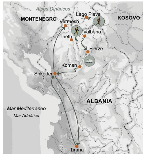
Itinerari del tresc.

Aquí teniu la crònica del tresc (no cal fer servir el vocable anglosaxó) de la colla d'amigues i amics, majoritàriament socis de la SEAS, durant el mes d'agost de 2021. L'originalitat d'aquesta crònica rau en què cada dia l'ha escrit un participant diferent