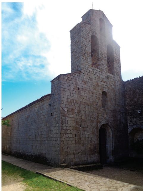
Santuari de la Mare de Déu del Coll.

Les marques blanques i vermelles continuen amunt, des que hem sortit encavalcant el GR 178 i el GR 83. Travessem