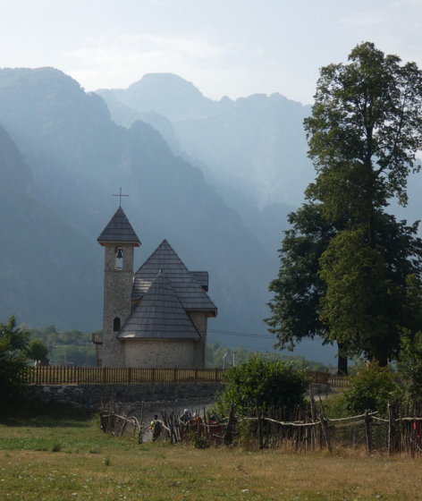
Església de Theth.

observant qui pren notes per poder endevinar qui té l'encàrrec cada dia... un al·licient més!