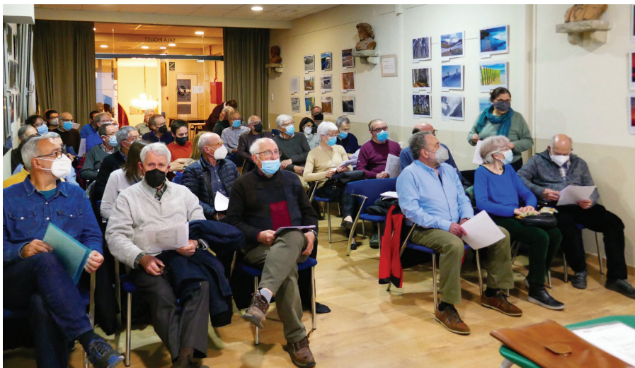
Assemblea general de la SEAS celebrada el 5 de març de 2022 a la sala Piquet de l'Ateneu Santjustenc.