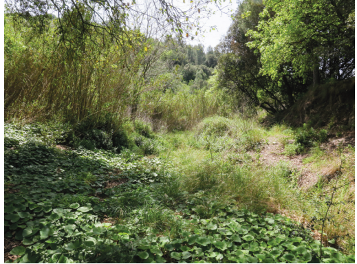
Clariana sobre la riera uns metres més avall del punt de la foto anterior en direcció a Sant Just. A partir d'aquí el pas dels caminadors és impracticable pel canyissar que es pot veure al fons de la imatge. Foto de Francesc Blasco del 15/04/2022.

Si l'observació del moment present la complementem amb un xic de memòria històrica del que hem vist els darrers anys podem afegir un parell de fets que posen en evidència que no hi ha hagut planificació a llarg termini en les accions que s'han dut a terme en relació als torrents o a la riera. Volem esmentar en primer lloc que la neteja de canyes del tram de la riera des de sota can Fatjó fins just abans de confluïr amb el torrent de la Font de la Beca va ser una actuació espectacular pel que fa a l'estassat de canyes que, uns anys més tard, va culminar amb l'eliminació de l'edificació que estava a tocar de la riera en les immediacions d'una boca de la mina de la Torreblanca. Avui, passats set o vuit anys, la riera està de nou plena de canyes fins al punt que en el tram superior és gairebé impracticable i els arbres que s'hi van plantar no han tingut la possibilitat de desenvolupar-se. D'altra banda l'encerclat de protecció que es va fer posteriorment davant de l'entrada de la mina esmentada, amb un bonic pictograma per posar de relleu la importància dels punts d'aigua pels amfibis resta marginal i invisible. Tot plegat feina feta perduda que a ulls d'aquell que va reconèixer en el seu moment la millora, queda decebut. Així, davant de la situació actual, cal concloure que les intervencions sense l'apropiada planificació i sense un programa de manteniment no deixen de ser flor d'un dia.