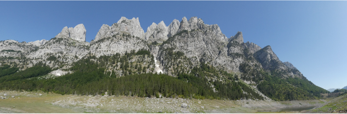
Muntanyes de Prokletije. Montenegro.

Albània, Shqipëria o Shqipëri en la seva llengua, ha restat durant molts segles aïllat de la resta d'Europa. Ha estat en els darrers anys que, principalment a partir dels canvis sociopolítics, s'ha fet més visible al món. La seva geografia eminentment muntanyenca ha marcat en bona part la seva història. Passejar per Albània és descobrir la seva diversitat ètnica, religiosa i cultural, i caminar per les seves muntanyes és una de les maneres més interessants de conèixer-la.