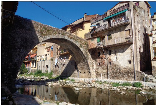
Pont Vell d'Osor.