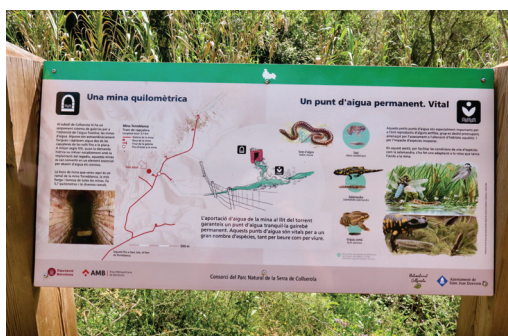
Plafó davant de la boca de la mina Torreblanca –coberta per la vegetació– situada a l'angle de confluència del torrent de Can Baró i el que ve de les Fatjones. Foto de Francesc Blasco del 15/04/2022.

D'altra banda, passejant per la Vall, o bé mirant el mapa, veurem que les aigües de la Vall de Sant Just acaben confluint a la riera de Sant Just, de traçat únic a partir del punt del Passeig de la Muntanya on es troba l'Institut. Des de la capçalera i anant avall, però, hem de fer esment dels torrents de Can Cuiàs, de les Fatjones i de la Font del Rector, de Can Baró i de la Font de la Beca, els quals ja són un sol curs poc més avall de can Vilà. Encara, però, el torrent de Can Biosca s'ajunta finalment a la riera passant l'Institut. Això no obstant, la riera es fa fonedissa uns metres més avall del pont de Can Padrosa del camí de la Muntanya, i no torna a ser oberta fins sota el revolt del carrer Onze de Setembre, sota can Mèlich. D'aquí, «emboscada» sota un cobert espès de canyissars