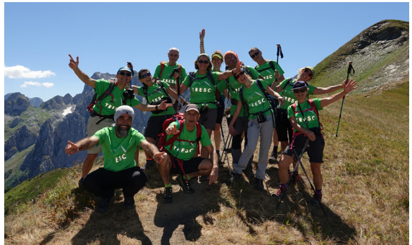
El grup al coll de Perdolec.

https://www.santjust.org/seas/publicacions/Tresc-Albania-Montenegro-agost-2021.pdf