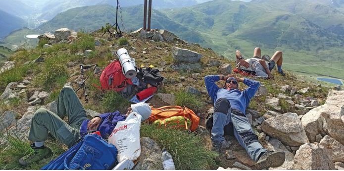
Descansant i gaudint del paisatge.

Estudiem el terreny per fer-hi l'acampada. El cim és massa pedregós per posar-hi l'esquena. Ja abans que els companys marxessin, vam veure que el coll per on havíem de fer la tornada, uns 50 m més avall, tenia tota una gespa suggeridora. Els vam encarregar que quan hi passessin ens diguessin si efectivament era apte per a dormir-hi. I sí, ens ho van confirmar, tot el coll era pla i amb un bon matalàs de gespa. Amb aquesta informació doncs baixem a preparar-nos el jaç. Portem una tenda de 3 places (nosaltres en som 4), però decidim que com que la previsió del temps és bona, i la temperatura també, no la muntem. Ja estarà bé, perquè un de nosaltres no porta ni estoreta ni funda de bivac, i li servirà d'aïllant del terra, que és tou, però humit, i per tapar el sac de la humitat de la nit. I també millor perquè dins de la tenda no podríem contemplar el cel mentre ens adormim. El cel, i els farells que ens acompanyen.