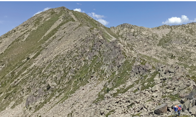
Passant la cresta des del Marimanha (a l'esquerra) al Vacivèr.

Aquest va ser el comentari d'un de nosaltres. I realment va ser una de les coses més emocionants: adormir-se contemplant el bé de Déu d'estels al firmament, la Via Làctia, els estels fugaços... i la llum del farell, allà dalt. L'havíem pujat nosaltres, el farell, les bateries i el trípod. Sort de l'ajuda d'alguns companys de la SEAS, perquè amb els 10 kg que portàvem a l'esquena ja en teníem prou i de sobres per pujar els 800 m aproximadament de desnivell des de l'aparcament de l'Orri, al plan de Beret, fins al cim del Vacivèr. Això els que hi van pujar directe, els que vam fer doblat en vam fer uns 100 més, de desnivell! Aquesta és una història afegida. Segons una versió de l'Alpina, el cim del Vacivèr n'era un, i segons una altra versió, n'era un altre. Resumint, alguns vàrem fer els dos cims, Marimanha i Vacivèr, passant per una cresta per anar de l'un a l'altre! Com dèiem, tota una altra aventura per explicar.