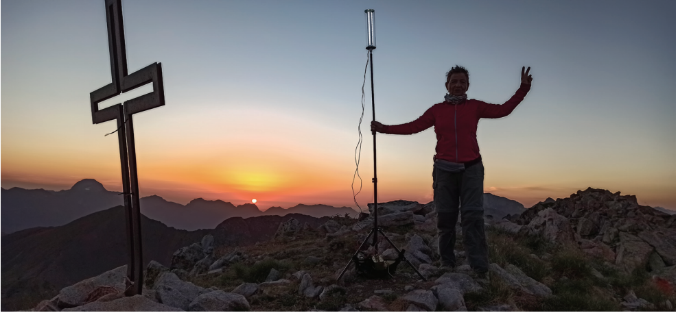
Objectiu assolit, 6.21 h del dia següent.

el nostre allà dalt, a la nostra esquerra, i els altres dos al davant. I així ens anem adormint, uns més aviat que els altres, contemplant estels fugaços.