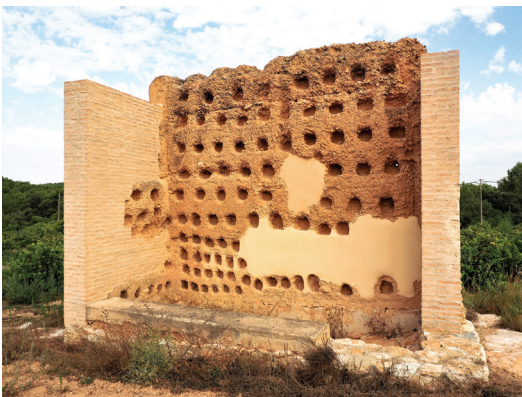
Colomar de l'Arboçar de Baix

Descripció: De planta rectangular d'uns 5,80 x 2,60 m, actualment només es conserva la paret llarga de la cara nord i les restes de les dues laterals, que tenen una amplada aproximada de 60 cm. La base de les parets és de maçoneria de pedra, i d'aquí arranquen tres filades de tapiera, amb una altura total que frega els 5 m. Per la part interior podem veure-hi arreglats tot un seguit de nials per als coloms.