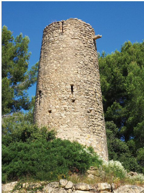
Torre de can Llopard de la Costa

Situació: Situada al cim d'un turonet a l'esquerra de la carretera BP-2427 que baixa de l'Ordal a Sant Sadurní, la veurem davant nostre tot just passat el veïnat dels Casots i a l'altura d'unes caves.