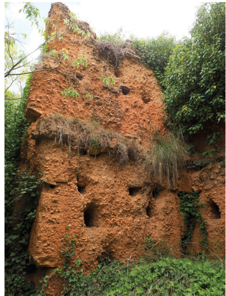
Torre de cal Pinya.

Situació: Situada a uns 850 metres en línia recta a llevant de l'anterior i a tocar de l'anomenat Camí del Castell que surt des del km 14,8 a mà esquerra de la carretera C-243b en direcció a Sant Sadurní d'Anoia, uns 400 metres abans del trencall a Torre Ramona i al Rebató. Si seguim aquesta pista 400 metres muntanya amunt arribarem a l'antiga masia de cal Pinya, avui pràctic-