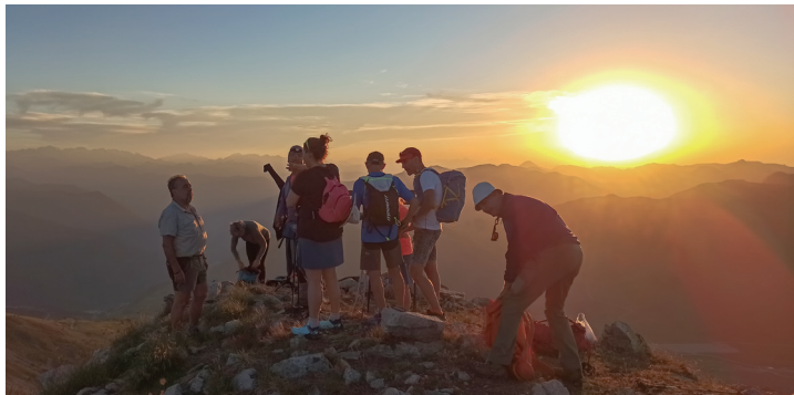
Altres grups ens van acompanyar dalt del cim.

Preparam el farell. Fem proves, que tot estigui correcte, fem simulacre d'encesa, ens fem fotos els uns als altres i sopem tots plegats, esperant que siguin les 21.56 h exactes, quan hem de fer l'encesa oficial.