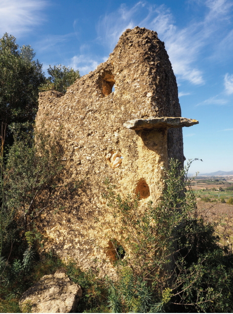
Colomar del Mas Pigot

Història: Com en els casos anteriors no hi ha documentació que avaluï una datació d'aquest colomar. Jordi Bolós apunta que la seva cronologia tant pot anar des de l'època musulmana fins als darrers segles medievals.