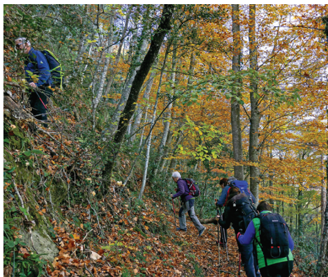
Camí cap el cim del Puigsallança.

La iniciem per un camí força fressat que duu al santuari de Santa Maria de Finestres (887 m). Més amunt arribem a una bifurcació que, per l'esquerra, va al Puigsallança