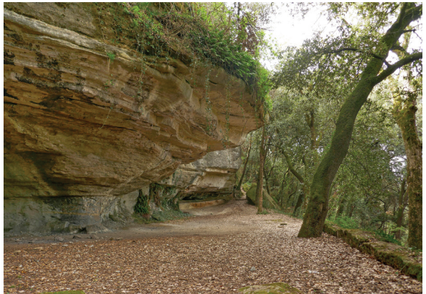
Balma de la font de la Baronesa.

Si mirem ara en direcció sud-oest — l'únic lloc on podem anar des d'aquí— veurem dos petits camins. Un, més amunt, sembla que passa pel fil de la carena i l'altre baixa suaument per la cara de ponent del serrat del Castell. És aquest últim el que hem de prendre. Baixarem molt suaument per entre un bosc que continua sent de pins i roures però més espès ja que estem a la cara obaga de la serra. En mig quart d'hora aproximadament arribem a una gran balma amb una font sota del camí: és la balma de la font de la Baronesa (1 h 1 m). És un indret solitari i frescal. Des d'aquí el nostre camí ara puja perquè va a trobar el camí carener que hem deixat abans. En un altre mig quart d'hora anem a sortir a un camí més ample i fressat (1 h 8 m), que ve de prop de les Punxes sense fer la volta que nosaltres hem fet per passar per Savassona. Agafem aquest camí a la dreta i, primer planer i després en franca baixada, ens porta al Mirador de Tavèrnoles (1 h 18 m).