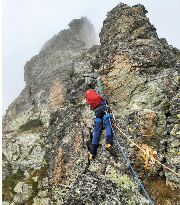
Cresta cap a la Punta Venezia.

El nostre objectiu del dia és una aresta elegant i llarga que surt directament al cim de la punta Venezia, un bec rocós de 3.100 m que forma part de la cadena axial del Monviso. En arribar a la base de l'aresta, ens dividim en tres cordades i comencem a remuntar llarg