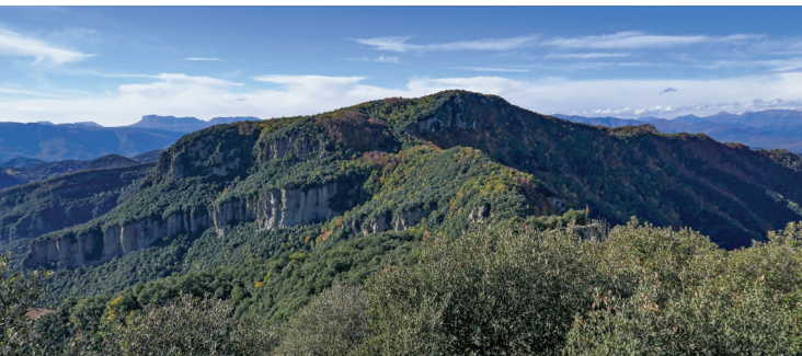
Puigsallança vist des del castell de Finestres.

Com cada any, a principis d'estiu, una comissió de la SEAS ens reunim i comencem a posar fil a l'agulla per tal de buscar el cim on instal·lar el nostre Pessebre, dissenyar la ruta més adient i buscar un allotjament on ens puguin acollir per pernoctar i celebrar les restolines. Tot seguit anem a preparar l'excursió, mirem el millor emplaçament on col·locar el Pessebre i visitem el lloc on fer l'estada. Mirem de quadrar-ho tot i, si ens sembla correcte, ja podem anunciar la sortida.