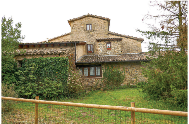
Masia de Les Punxes.

Per continuar ens hem de situar en el petit espai que hi ha davant d'aquesta paret sud de l'església —és el lateral que tindrem a la nostra dreta si ens mirem frontalment l'entrada del temple. Aquí trobarem les marques del PR-C 40.1, que seguirem el primer tram de la caminada. És un corriol en lleugera pujada enmig d'un bosc de pins no massa grans i amb el sotabosc força espès. Serà una pujada d'una mitja hora que desemboca perpendicularment en una pista planera i en molt bon estat (28 m). Nosaltres l'hem d'agafar cap a l'esquerra però momentàniament la seguirem un parell de minuts cap a la dreta per contemplar la bonica casa de les Punxes (30 m), masia de planta basilical, probablement del segle XVIII.