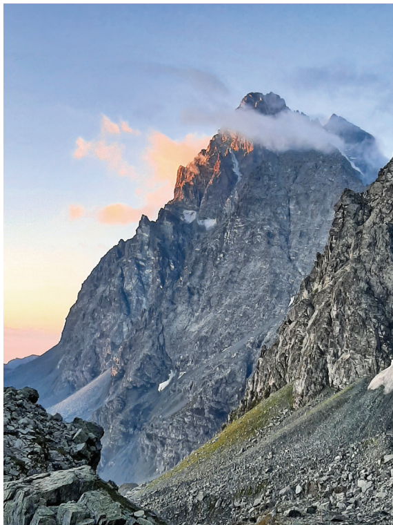
El Monviso, des del refugi Vitale Giacoletti.

travessem com a funàmbuls assegurats per un tros de corda al nostre arnès. Uns passos més i ens abracem contents al punt més alt. Quina bella iniciació al món de l'alpinisme!