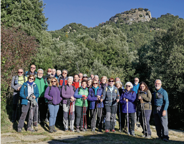
Grup que va pujar al Puigsallança al Raspat, punt d'inici i final de l'excursió.

del castell de Finestres, amb bones vistes des de la Garrotxa fins al golf de Roses.