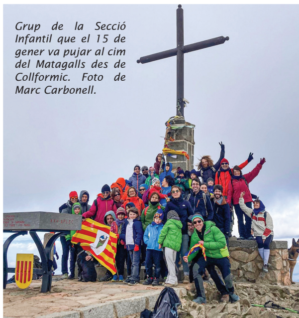
Grup de la Secció Infantil que el 15 de gener va pujar al cim del Matagalls des de Collformic.

Enllaç al calendari de la Secció Infantil.