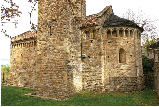
Església parroquial de Sant Esteve.

coberta. També podem admirar unes altres arcuacions en el mur lateral del sud.