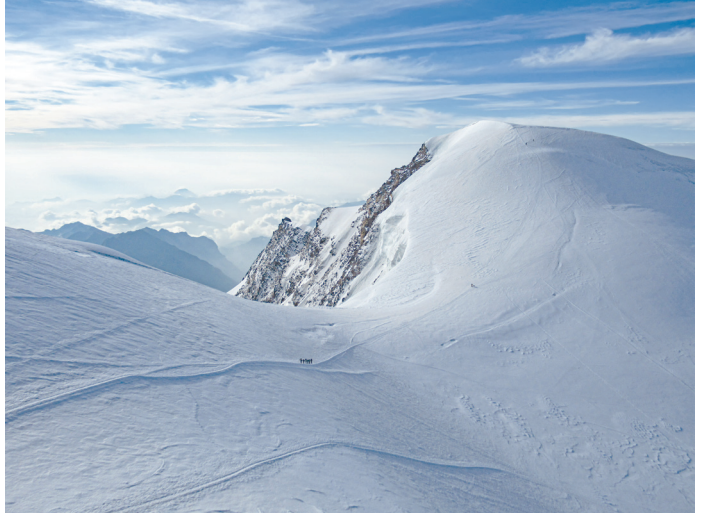
Piràmide Vincent, des del Balmenhorn.

gada de fusta que es compon de diversos nivells i que es divideix en petites habitacions amb vistes a la vall o a la glacera. Des de la teulada, es poden admirar els pics, mentre que a les moltes terrasses que hi ha, els alpinistes descansen i prenen el sol ja gairebé tardorenc. A l'interior, el bar bull amb una multitud d'alpinistes i les gairebé 100 referències de vins que ofereix la carta! La cuina desprèn aromes agradables de focaccia i la calor del lloc convida a protegir-se del fred de l'exterior.