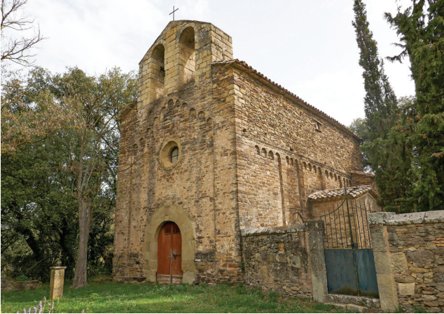
Sant Pere de Savassona

Es tracta d'una gran edificació o conjunt de més d'un edifici que s'aixeca a la carena del serrat del Castell, serreta que s'alça a llevant del nucli urbà de Tavèrnoles i que ve a ser aquest primer replec de les Guilleries que esmentàvem al títol d'aquest escrit i que nosaltres tenim a la nostra esquerra. Al cap de poc trobem una altra cruïlla i veiem davant nostre una església romànica. Una curta pujada ens hi porta (47 m). És Sant Pere de Savassona, també del segle XI i que era la parròquia a l'edat mitjana, quan la majoria de la població s'estava en un lloc més elevat abans que acabessin establint-se a la plana.