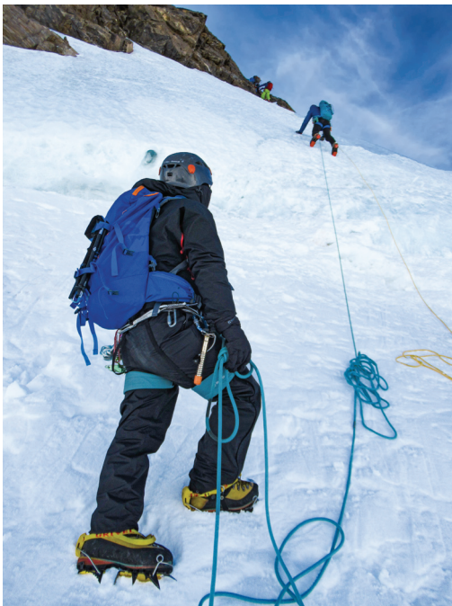
Escalant la paret gelada del Corno Nero.

L'endemà repetim la processó: esmorzar, equip, botes, grampons, encordament... i sortim novament cap a la glacera. Les serpentes de llums indiquen una gran activitat de cordades, moltes dirigint-se com nosaltres cap a la Capana Margherita. L'alba ens arriba novament al coll de la Piràmide Vincent, regalant-nos una vegada més una àmplia paleta de colors.