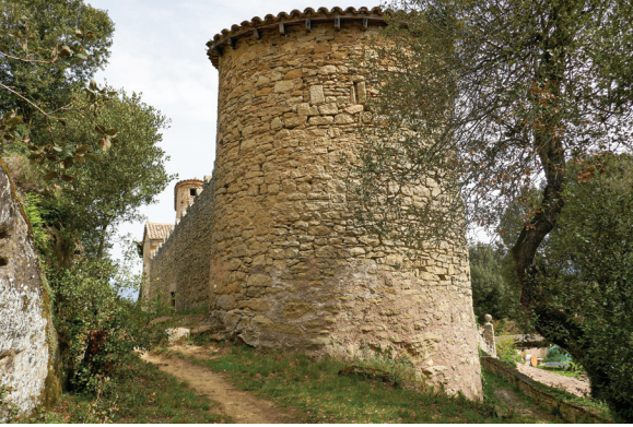
Castell de Savassona.

Si mirem ara en direcció sud-oest — l'únic lloc on podem anar des d'aquí— veurem dos petits camins. Un, més amunt, sembla que passa pel fil de la carena i l'altre baixa suaument per la cara de ponent del serrat del Castell. És aquest últim el que hem de prendre. Baixarem molt suaument per entre un bosc que continua sent de pins i roures però més espès ja que estem a la cara obaga de la serra. En mig quart d'hora aproximadament arribem a una gran balma amb una font sota del camí: és la balma de la font de la Baronesa (1 h 1 m). És un indret solitari i frescal. Des d'aquí el nostre camí ara puja perquè va a trobar el camí carener que hem deixat abans. En un altre mig quart d'hora anem a sortir a un camí més ample i fressat (1 h 8 m), que ve de prop de les Punxes sense fer la volta que nosaltres hem fet per passar per Savassona. Agafem aquest camí a la dreta i, primer planer i després en franca baixada, ens porta al Mirador de Tavèrnoles (1 h 18 m).