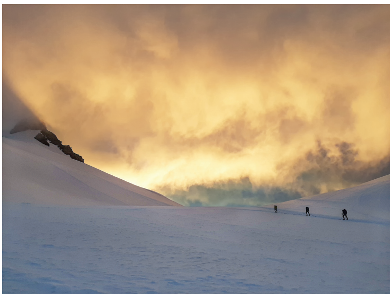
Primeres llums del dia al Monte Rosa.

El refugi Gnifetti és una autèntica joia en tots els sentits: ubicat dalt d'un sortint rocós, domina una impressionant glacera la qual, com un brau riu gelat, baixa vertiginosament des dels cims alpins vall avall. El refugi és una construcció allar-