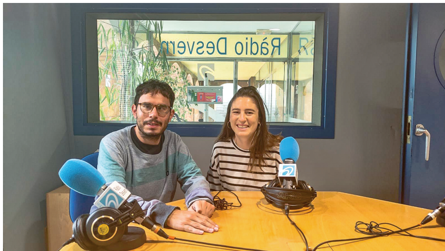
La Secció Jove de la SEAS a Ràdio Desvern.