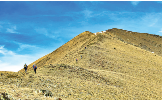
Pujant per la carena cap el cim del pic de Salòria.

Amb la intenció de fer l'ascensió al pic de Salòria, a la partió entre l'Urgellet i Vallferrera, el dia 10 de juliol de 1882, Jacint Verdaguer va passar la nit als cortals d'Os 1 . Hi havia arribat per la banda de l'ermita de Santa Magdalena i dels cortals de Civís. Com el mateix Verdaguer ens explica, als cortals d'Os «no es veia fum, ni foc, ni altra claror que la de les estrelles; no se sentia lladrar un gos, ni belar una ovella, ni miolar un gat; (...) Quan ja estàvem aconsolats de dormir a la serena, en una casa apartada del poble vegérem obrir-se'ns la porta y convidar-nos a entrar un jove de divuyt anys, alt i ben plantat.» 2 «L'endemà, a les 6 el matí, emprenguérem la pujada d'eixa aguda y hermosa montanya» 3 .