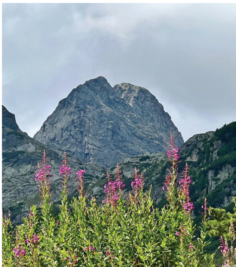
El Malyovitsa. Foto de Marta Gabàs

La tornada consisteix a desfer el camí fins al telefèric de retorn a Borovets. Hem començat a caminar a les 10.30 i hem arribat el telecabina per baixar a les 17.10, total 6.40 hores incloent el pic-nic.