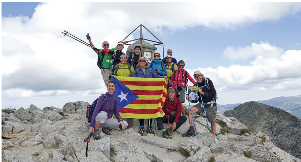
El grup complet al cim del Musalà.