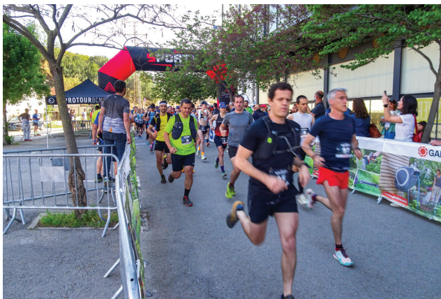
Sortida d'una de les curses.

Dissabte 6 de maig de 2023 va tenir lloc amb un gran èxit la IV edició de LA MITJA DESVERN, amb una inscripció de 400 participants, que es van repartir entre les modalitats de 8, 15 i 21 km de recorregut.