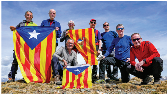
Cim del pic de Salòria.

El 29 d'abril de 2023, uns quants amics del Grup Veterà vam anar al pic de Salòria. Segurament que tots els que hi érem