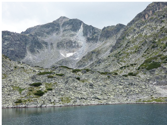
El Musalà.

Uniformats amb samarreta verda sortim de Sofia i després d'una hora i mitja arribem a les muntanyes de Rila, on un telefèric ens puja fins