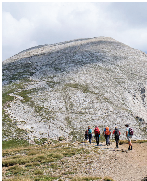
Camí del Vihren.

Tocava enfilar el camí de retorn amb parada per dinar al refugi de Demianitza des d'on seguiríem