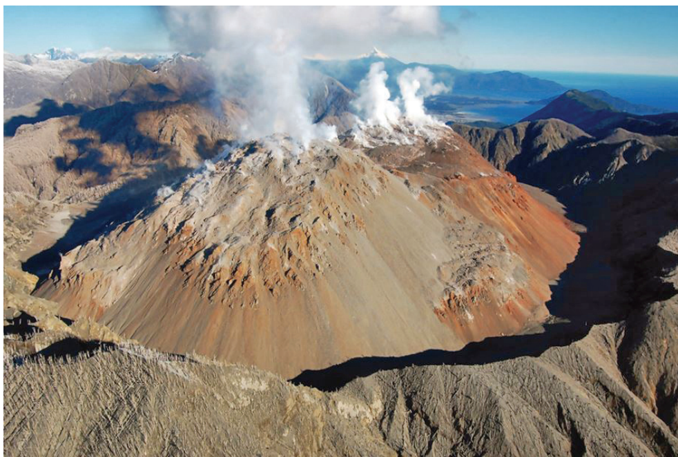
Foto feta l'1 de maig de 2022, 14 anys després de l'erupció del volcà Chaitén. Regió de Los Lagos, província de Palena, Xile.