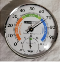
Figura 2. Higròmetre termòmetre utilitzat.

-Sí, positiu, quants glops (1 glop: 70- 80 ml d'aigua): 3 glops/persona: 2 persones.