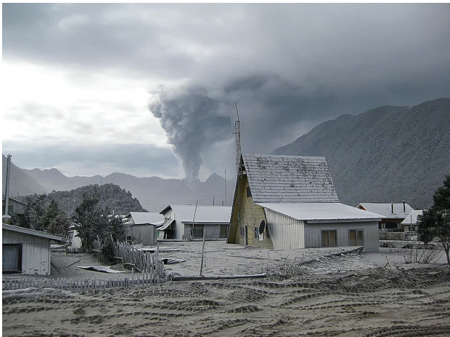
Poble de Chaitén cobert de cendres i al fons el volcà.

Mentre comencem la caminada, en Nicola ens parla de la seva experiència de l'erup-