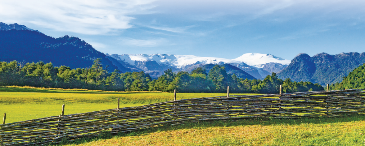
Parc Nacional PumaLín des de l'entrada de Pueblo Amarillo.

L'any 2018 es va crear el Parc Nacional PumaLín Douglas Tomkins, després que des dels anys 1990, el mateix Douglas Tomkins (empresari de la indústria de la moda), anés comprant propietats amb la intenció de preservar-ne el seu valor biològic i recuperar-ne l'ús públic. Ubicat a la Patagònia xilena, al començament de la coneguda Carretera Austral, PumaLín és un parc de 402.392 hectàrees amb predomini dels boscos d'alerços mil·lenaris i espècies forestals com la tepa , el canelo i la tiaca . La filantropia i el naturisme de Tompkins, doncs, va permetre protegir tot un territori de les activitats extractivistes més agressives (especialment de les forestals i de projectes hidroelèctrics) i, per tant, va donar lloc a la conservació d'una gran reserva de la biosfera i al seu gaudi per