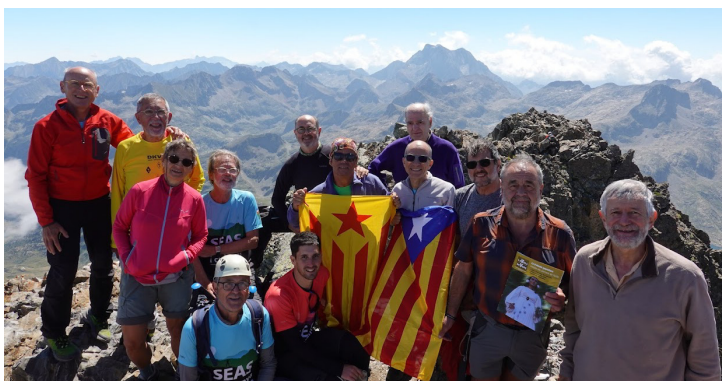
Figura 5. Grup de la SEAS al cim de la Gran Faisha (3.002 m). Al fons el Venhamala sense neu.