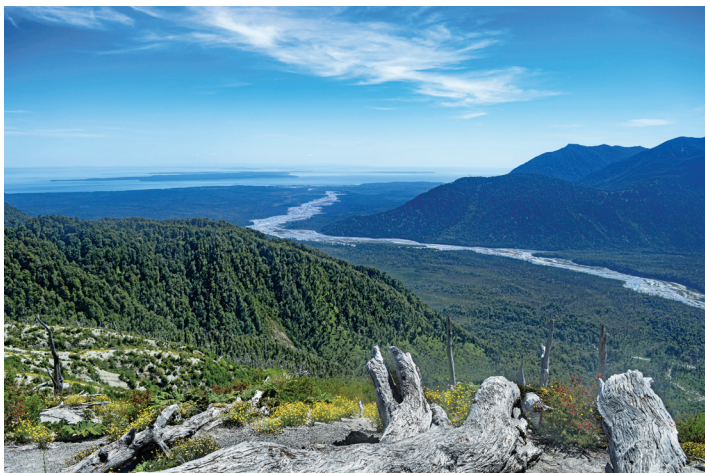
Vistes a Chaitén des del volcà.

onals pel país. Situació que s'ha repetit en altres parts del món: els Alps com a símbol nacional i paisatge idíl·lic de la Suïssa dels segles XIX i XX o també com a indret identitari i retòric de la Itàlia de Mussolini; els Andes amb la identitat xilena; els Pics d'Europa com a símbol de la reconquesta espanyola medieval; o Montserrat amb la identitat catalana, entre altres. Sembla, doncs, que la protecció de la naturalesa és un reflex del conjunt de valors i percepcions culturals que es tenen sobre aquesta i, encara més, és una conseqüència de la