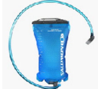
Figura 4. Bossa de Camelback.

Cal recordar, que l'edat és un hàndicap per beure, ja que no es té set. Malgrat que la ingesta de líquids en l'esmorzar al refugi va ser adequada, no podem dir el mateix a la pujada fins al coll de la Faisha; abans de pujar al pic i la reposició de líquids a la baixada.