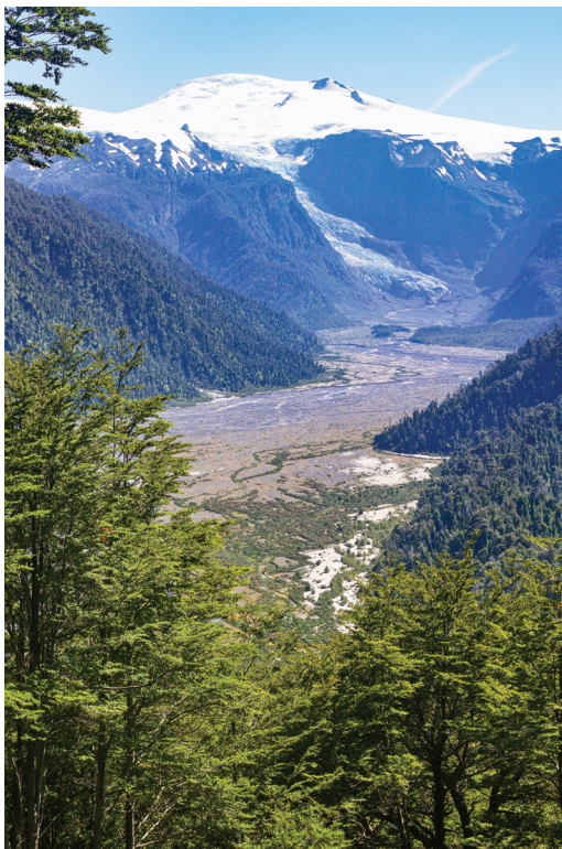
Glacera Michinmahuida al fons i el rastre del per què abans ho era.

Finalment, sembla que la bona voluntat de Tomkins fou acceptada i, ja un cop mort, el parc fou traspassat a l'Estat xilè. Per una altra banda, no obstant això, l'establiment de la reserva natural també implicava que no se'n pogués fer un ús agrícola ni ramader, i que tampoc se'n pogués treure cap tipus de recursos, tal com els vilatans havien fet sempre; simplement convertia aquell tros de terra en un espai bucòlic.