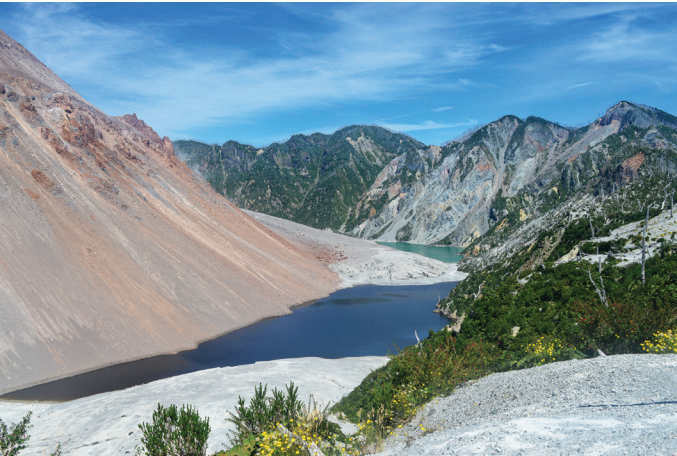
Part del dom central del volcà i llac.

Potser, doncs, la clau rau en posar el focus sobre els processos de protecció: qui hi participa i com s'acaben gestionant dits espais. Així mateix, l'Amazònia, sovint considerada com una selva verge, en veritat ha estat habitada i gestionada per diferents grups d'humans durant segles. Tot i així, des de les cultures occidentals, ens hi seguim excloent. Precisament, aquesta visió ha generat que, per exemple, als Estats Units de finals del segle XIX, s'implementessin parcs naturals sobre territoris habitats per pobles indígenes, que havien gestionat i cohabitats aquell territori durant centenars d'anys, i als quals se'ls expulsava de la zona amb el pretext del gaudi d'una població determinada. Curiosa la paradoxa de veure com àrees silvestres i salvatges que els europeus havien pretès domar, més tard, els colons van voler protegir com a font d'identitat. I és que diversos historiadors concorden que l'origen dels parcs nacionals als EEUU ve de la necessitat de crear determinats símbols naci-