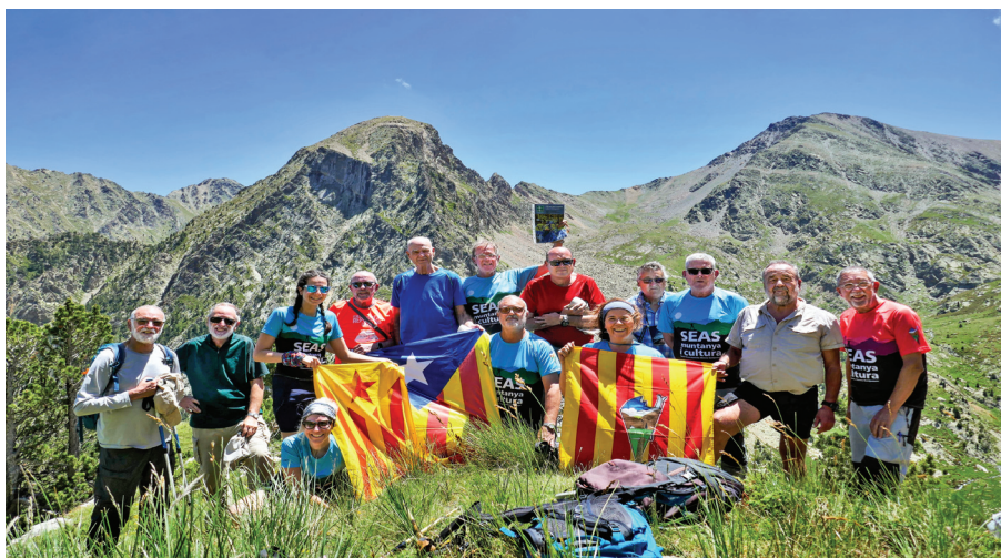
Sortida de Veterans 2023. Grup al cim de la Punta SEAS (2.293 m).