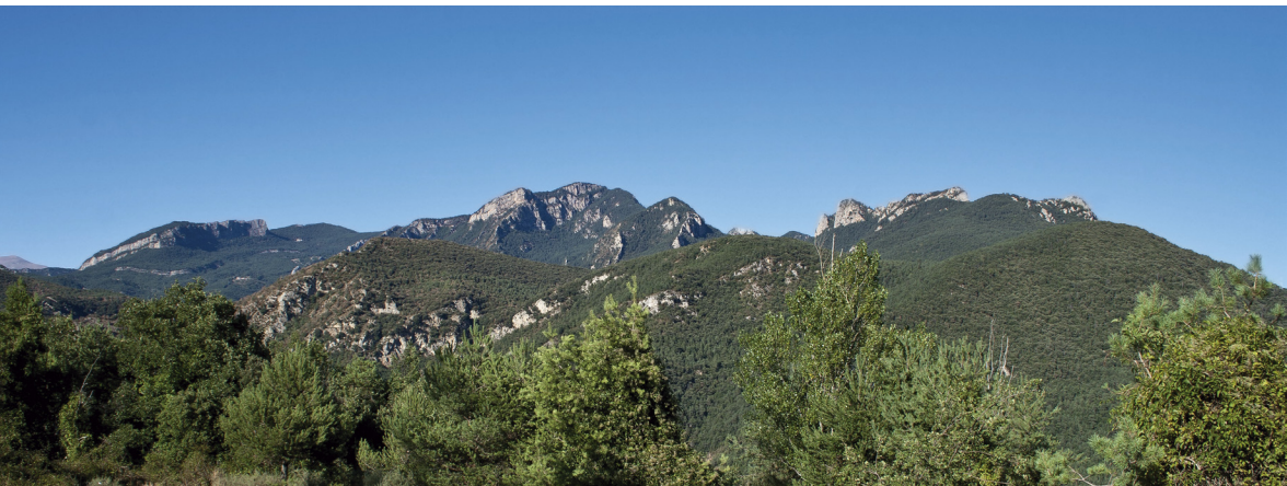
El Graell de Pujals i cingle, Sobrepuny, Picamill i Cap de Tastanós.

El topònim Sobrepuny és enigmàtic. Ben pensat, però, també ho són moltes de les denominacions al seu entorn: canal Fornosa, Manrell, Vallicorba, Banyacorba, Picamill, puig Cubell, Espades o Llena de Cuirols. Són denominacions que conviuen