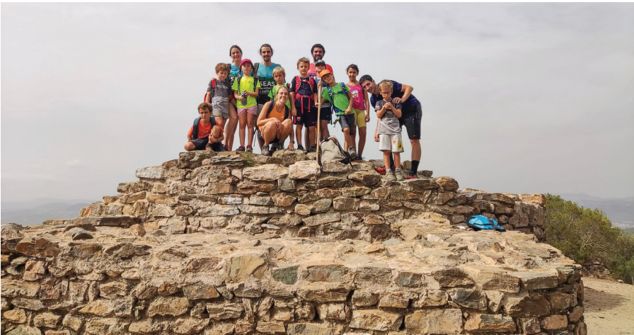
Primera sortida de la temporada de la secció Infantil a la Penya del Moro.

24/09/2023 - L'excursió llarga fou una circular que des de Maçaners va recórrer els cingles de Costafreda a través del grau dels Rucs i dels miradors dels Graus amb un recorregut de 14,1 km i un desnivell de +658/-665. L'excursió curta també fou una circular amb inici i final a Vallcebre passant per l'ermita de Santa Magdalena i a partir del grau de la Mola va recórrer la cinglera de Vallcebre fins a Cal Menut, cim del Tossal Llisol (1.328 m), ermita de Sant Ramon i tornada a Vallcebre, amb un recorregut de 10 km i un desnivell de +367/-368 m. La participació va ser de 29 excursionistes.