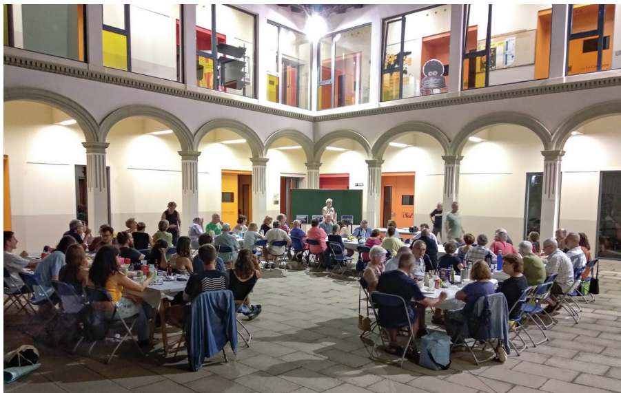
Sopar de Motxilla de 2023 al pati de Les Escoles.