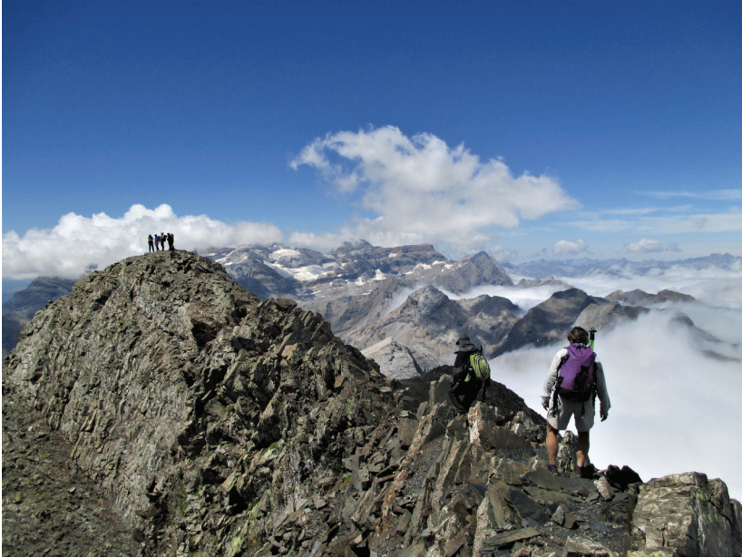
Segon premi i premi a la millor foto per votació popular: «Crestejant», d'Albert Cortès