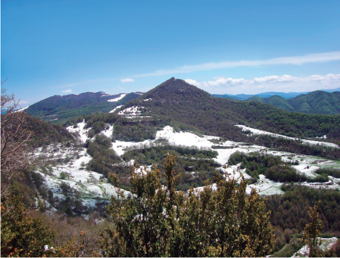
Puig Cubell a Ciuret (Vidranès).

homònim puig Cubell (1.488 m) prop del llogaret de Ciuret, al Vidranès, un puig Cubell que ja apareix citat a l'acta de Consagració de l'església de Sant Hilari de Vidrà l'any 960. És el Monte Calvelo, que més de mil anys enrere, quan Ató, bisbe de Vic consagrava la dita església, ja hauria derivat a Cauvell, o qui sap si ja a Cubell, tal com es coneix avui. Un altre adjectiu, doncs, referit a una singularitat natural. I encara hi ha altres puigs Cubell al terme de Riells, al de Riu de Cerdanya, al de Montagut i Oix, al de Vilanova de Sau o al de Camprodon.