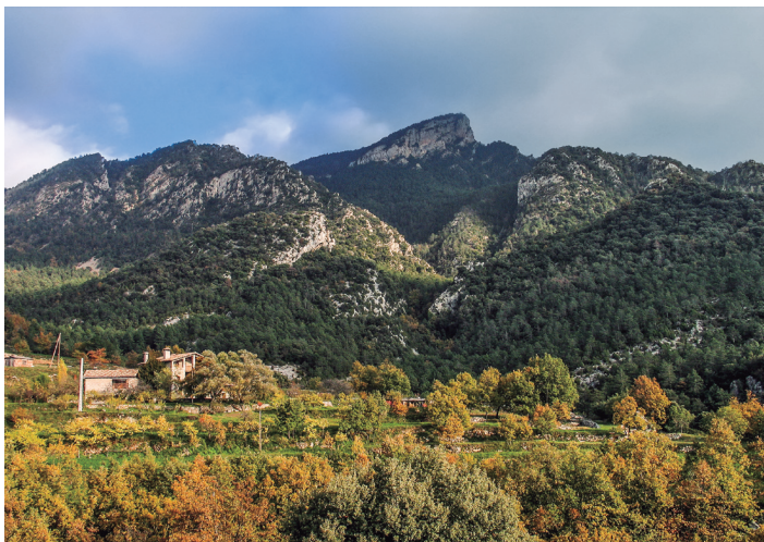
Sobrepony des de la Nou de Berguedà.

El terme canal Fornosa és un altre dels topònims estranys, i també molt interessant en el seu origen. A la nostra geografia hi ha força termes amb l'arrel "forn". Alguns s'explicarien per l'existència d'alguna antiga instal·lació per a la cuita de materials d'obra, però segurament que ben pocs, i sempre propers a nuclis habitats. El terme «forn» a què volem referir-nos aquí té un origen probablement preromà. «Forn» és un adjectiu que ha perviscut invariable des de fa segles i apareix generalment referit a un espai enclotat, enfonsat, reclòs, a una vall fluvial profunda, amagada; un terme antiquíssim, segurament anterior a la vinguda del llatí vulgar a terres peninsulars, un terme referit a una formació natural específica. És el cas del serrat el Forn (Sant Pere de la Portella), de Forno (petita vall que també dona nom al pic de Coma-lo-forno), de Fòrnols de Cadí, de Fornells, de Fornons (cova a Orrit, Tremp), de Forneros (vall de Boi), entre molts altres a la geografia. És sorprenent la força històrica d'aquest nom i com s'ha conservat: