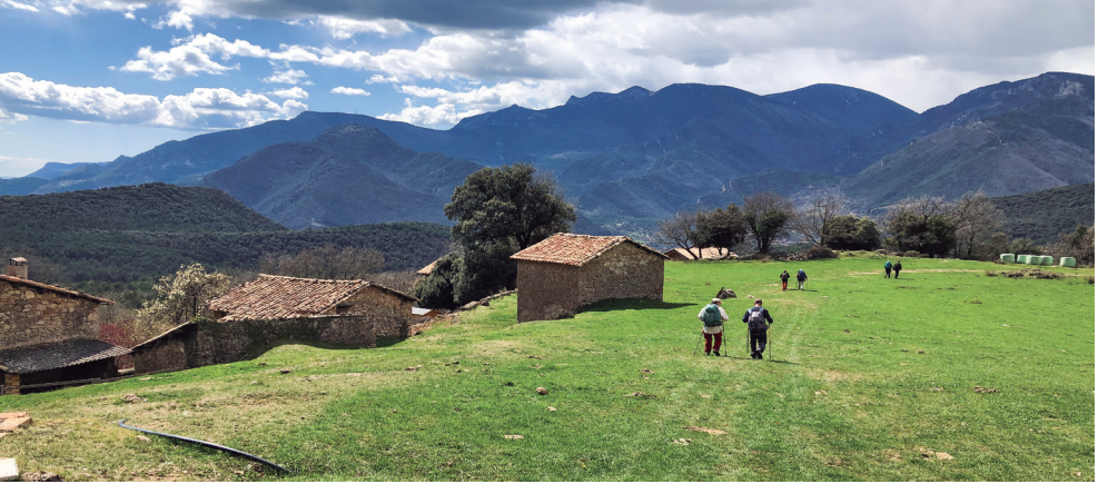
Camí del Sobrepuny a la Nou de Berguedà.

amb altres noms que no ho són tant, de misteriosos, o ben poc. Comencem per aquests darrers més explícits i proposo que tot examinant-los en un cert ordre, anem imaginant-nos quina mena de paisatge i bosc envolta la serra de Sobrepuny: collada de Caselles, collet del Faig, collet del Pi, coll de la Plana, collet del Llop; planell del Bac, els Llisets; baga Negra, baga del Roig, bac del Pla; les Agudes i tartera de les Agudes, les Fraus, l'Estimbador, cingle dels Prats, cingle de l'Heura, roc Esquerdat, roc del Querol, Grau de Dalt i de Baix; canal Closa, clot de l'Avet. Tota aquesta llista - i molta més - en un espai muntanyós de pujants i baixants entre els 876 m de la Nou i els 1.656 m del Sobrepuny, que un bon caminador pot recórrer en menys d'una jornada. Són noms que descriuen el lloc de manera viva, natural i genuïna. Són noms que dibuixen amb precisió el terreny i panorama que anàvem veient mentre fèiem camí aquell clar i lluminós matí del primer diumenge d'abril. Vàrem veure cims, collades, plans, recs, cingles i obagues que en algun o altre moment, segurament que segles enrere, van