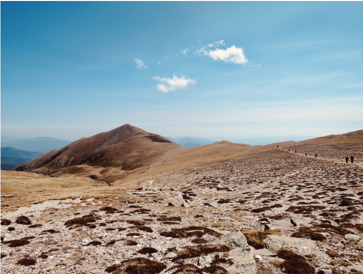
Premi a la millor foto en excursions SEAS: «Over the moon», de Xavier Bardají