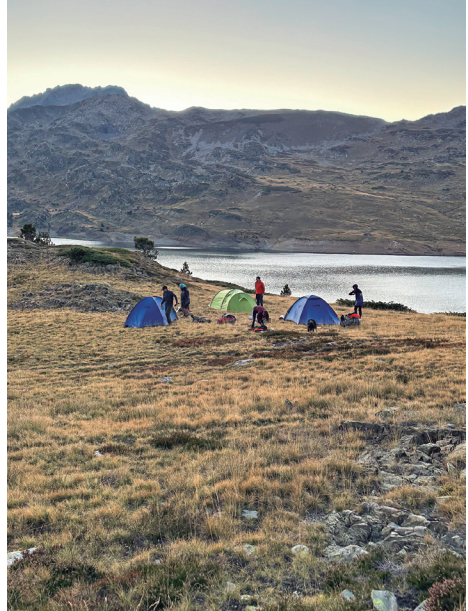
Moment de plantar tendes a la vora de l'estany de Lanós.

El despertador sona a les 7.00 h del matí i a la majoria d'integrants de la sortida se'ls