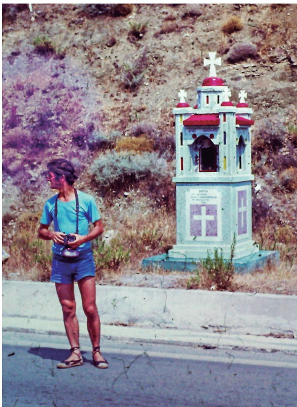
Una de les moltes capelletes en els vorals de les carreteres gregues.

Aquest mateix estiu, el dia 16 d'agost en Pepe i jo sortíem de viatge amb en Joan i el seu Renault 6, conduït per ell mateix. Després de visitar Venècia creuàrem l'antiga Iugoslàvia fins a arribar a Tesalònica, i des d'aquí un bon tomb per tota la Grècia continental, i tornada cap a casa