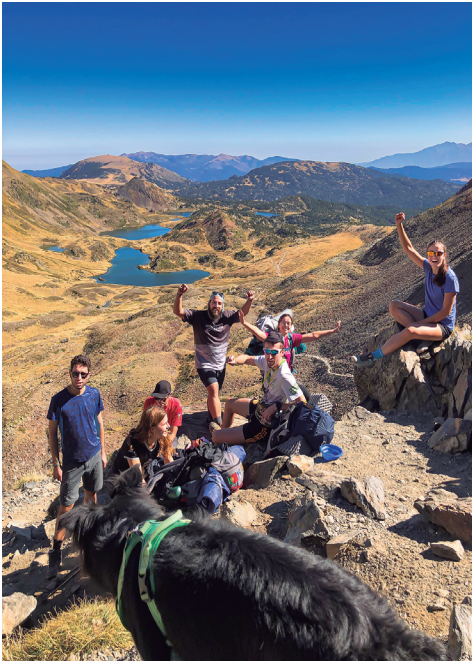
A mitja ascensió, amb alguns dels 12 estanys del Carlit de fons.

Anem fent parades perquè el grup es vagi reunificant i perquè els seus integrants puguem ingerir nutrients -altrament dit fruits secs o llaminadures- que ens donin un plus d'energia abans d'arribar al Carlit. La pujada no és gens tècnica excepte els darrers 200 metres d'ascensió, on cal ajudar-se de les mans per grimpar una mica, tot i que tampoc sense excessiva complicació. Feta