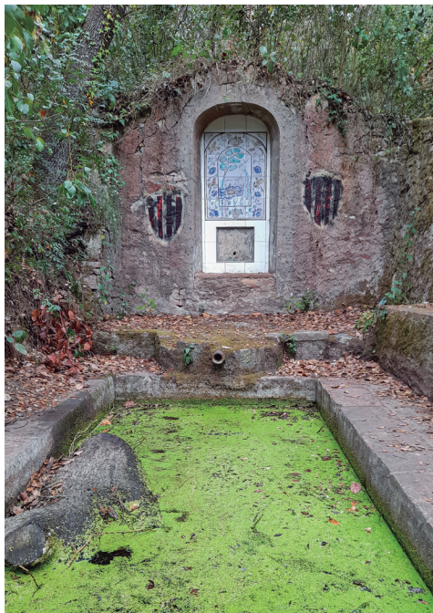
Font Vella de Can Catà

La font Nova de Can Catà és més espectacular que la Vella, situada en un pla amb una llarga taula i bancs de ciment per a trenta comensals. Enfront de la taula hi ha un petit amfiteatre, pels voltants del qual antigament hi circulava aigua formant petites cascades. El conjunt es complementa amb una misteriosa cova. Sembla ser que aquí es va celebrar, al 1912, el tercer casament de Leopoldo Gil Llopart, amo de Can Catà, que va voler complimentar el casori a la font, després de la mort de les seves dues primeres esposes en el part dels seus