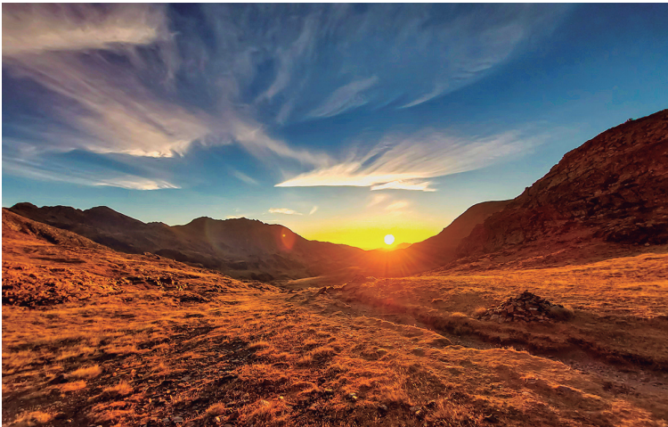
El coll de la Grava, a primera hora del matí.

Com que el narrador d'aquestes línies forma part del segon grup, en el present paràgraf m'excusaré d'oferir la visió només dels perseguidors. Ens vam motivar una mica, no ho negarem, i vam accelerar el pas amb la meta d'avançar el primer grup i recuperar el temps perdut. Restaven uns vuit quilòmetres i, jo diria que per sorpresa de tots, quan en quedaven sis el peloton va engolir la tête de la course . El camí anava resseguint el riu Tet, que precisament neix als voltants del Carlit i no s'atura fins a desembocar a prop de Perpinyà, i era molt assequible, fent del descens una ruta apta per a tots els públics. I tot i que no anàvem sobrats de temps, una darrera remullada va caure al llac de la Bollosa abans de posar fi a l'excursió cap a les dues del migdia.