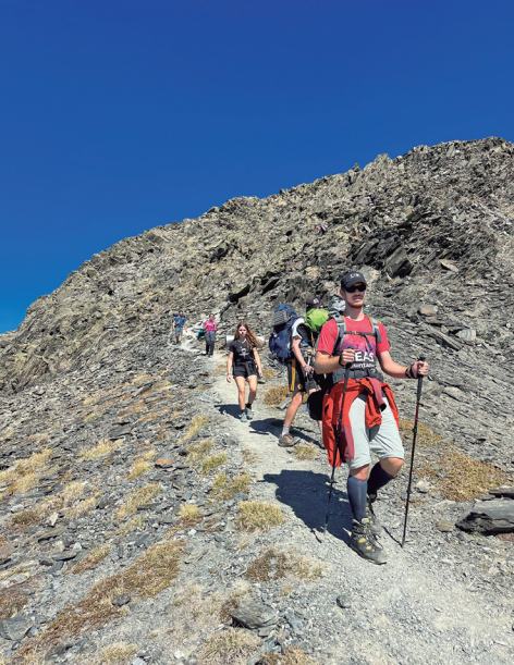
Descens del Carlit en direcció a l'estany de Lanós.

sabem classificar si com a cavalls salvatges o alguna espècie de la família dels cèrvids.