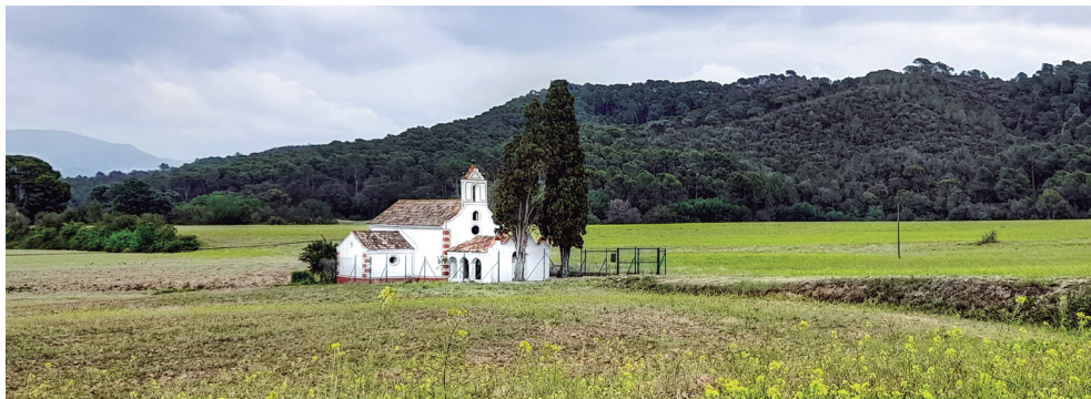
Santa Maria de les Feixes.

pollancre de la Riera, amb 23 metres d'alçada i capçada de 25 metres.