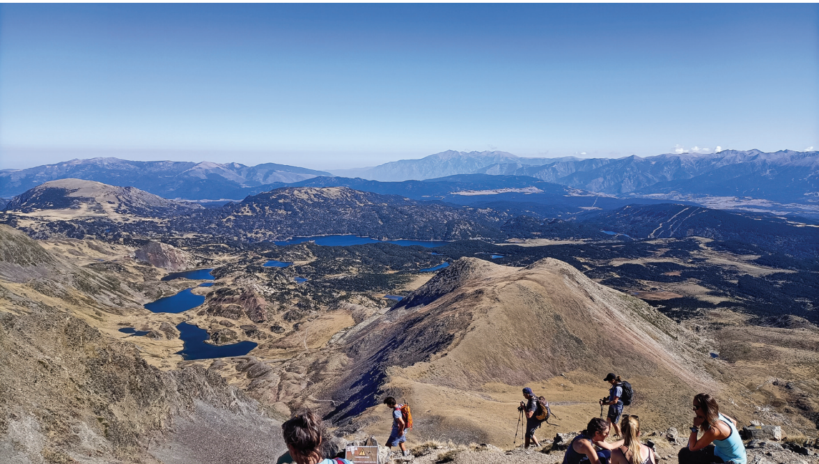
Cim del Carlit amb la ruta dels 12 estanys als seus peus i el llac més gran de les Bulloses en últim terme. A la part central del fons es destaca el massís del Canigó.