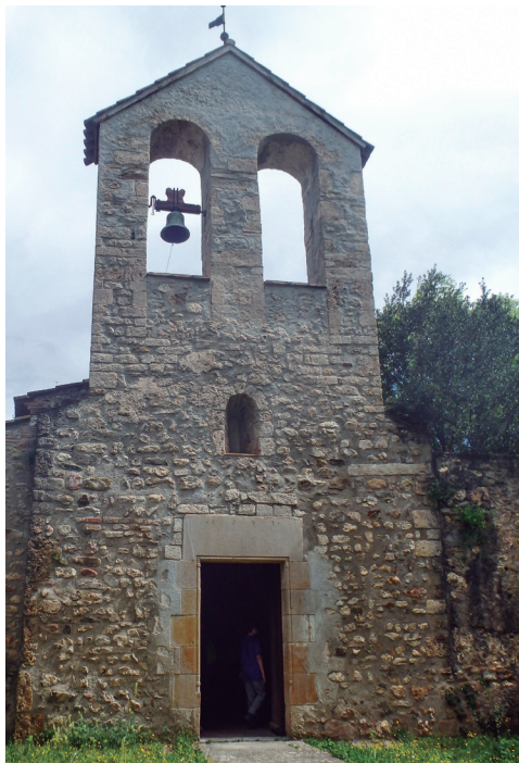
Sant Iscle i Santa Victòria de les Feixes

6.200 m. Hem pujat (en alguns punts amb gran pendent) per la serra d'en Ferrer fins a la carena, que marca el límit entre els termes municipals de Cerdanyola del Vallès amb Barcelona. Ara veiem la capital de Catalunya, des d'un mirador natural de gran bellesa. A ponent d'on som, coronant la carena, s'alça el turó d'en Fotja (349). Aquest camí carener sempre és molt transitat, tant per caminadors com per esportistes en bicicleta o corredors. Per aquí també passa el PR C-35. Caminant a ponent per la carena, passarem per davant d'un famós xiringuito