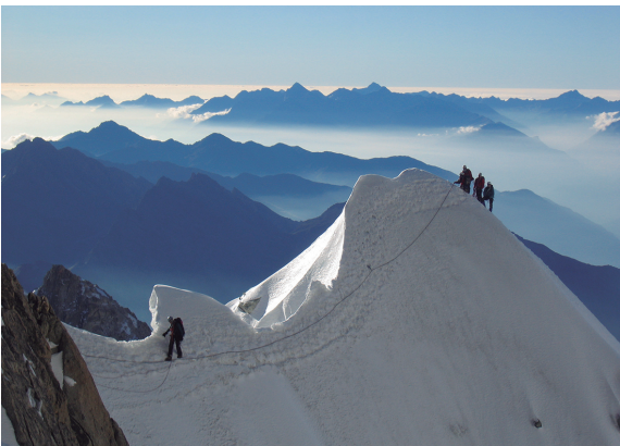
2005 1r premi «Adormides».