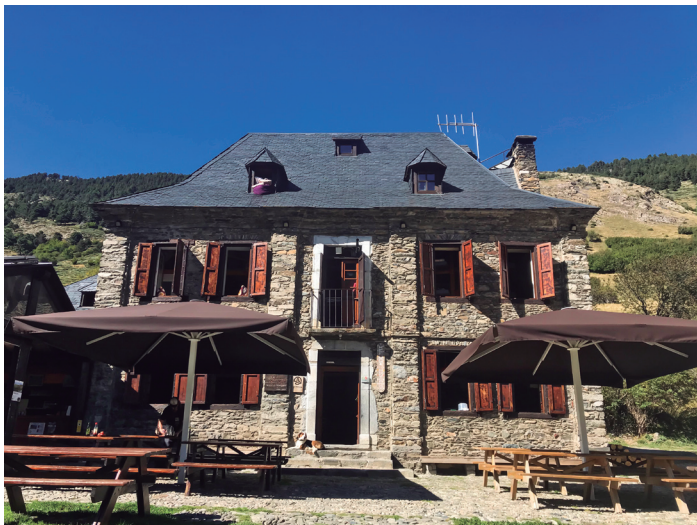
Alberg de Montgarri

La marededeu de Montgarri apareix a la tradició de les marededeus trobades que, segons les llegendes populars dels segles XVI-XVII, s'havien amagat abans de l'ocupació musulmana i foren trobades més endavant, envoltades de prodigis, per pastors i ermitans. S'explica en totes les llegendes que les imatges s'havien de quedar en l'emplaçament inicial, i, per aquesta raó, s'aixecava una capella, una petita església o un altar, en el lloc on havien estat trobades. En el cas de la marededeu de Montgarri, la llegenda diu que un pastor veia que un bou es quedava cada dia al mateix lloc. Astorat, el pastor decidí investigar i trobà la imatge que posteriorment fou nomenada patrona dels pastors.