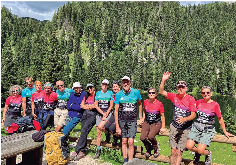
Foto del grup que va participar al tresc per Eslovènia, a l'esquerra els dos guies.

És d'hora i fa molta calor, i fem un banyet a la platja de pedres que hi ha al final del passeig. Després sopem uns bons plats d'amanides, sardines i peix fregit, comprem un gelat i ens el mengem durant el concert, ja habitual, a la nostra placeta. I, de mica en mica, la gent comença a desfilar cap a l'hotel. Ara sí, s'ha acabat el viatge i demà és el dia de tornada a casa.