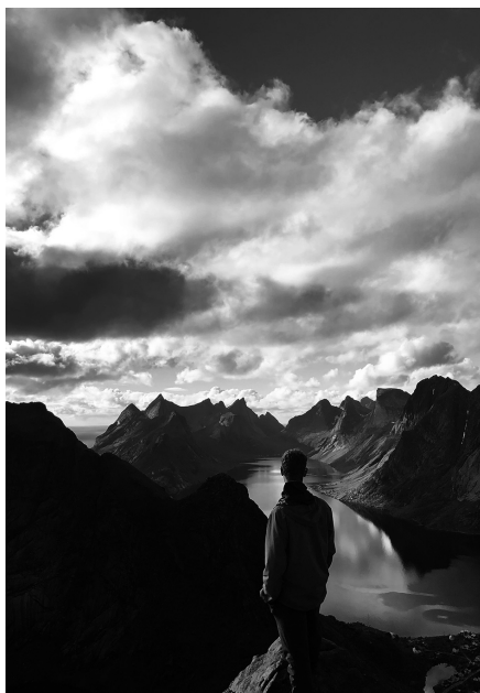
2023 1r premi «Montanyositat».