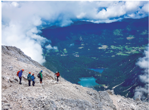
Baixant del Mangart.

La complicitat amb el desbocat líder de la banda va arribar a extrems hilarants.