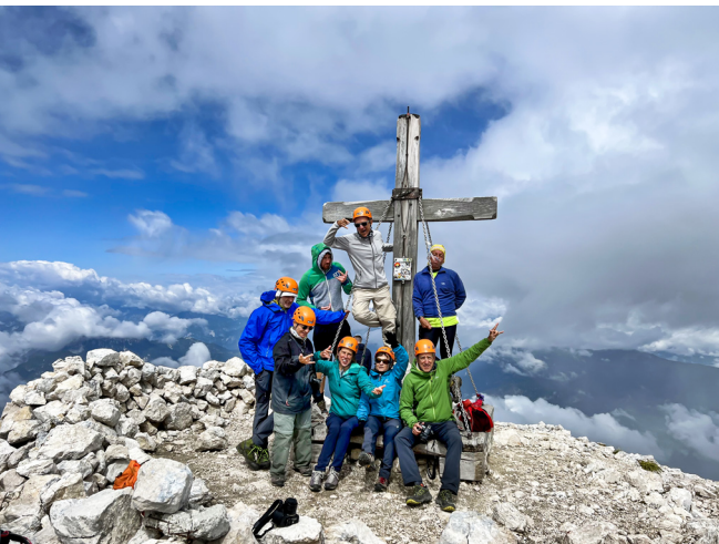
El grup al cim del Mangart.