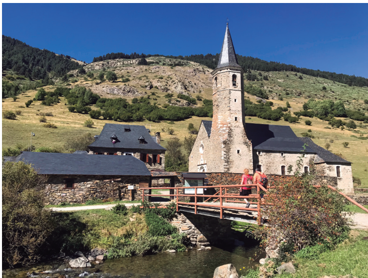
Vista de Montgarri des de la riba dreta de la Noguera Pallaresa.

Montgarri és un centre d'espiritualitat i d'esbarjo de la comarca i rodalies, tant catalanes com franceses. El 2 de juliol hi té lloc un aplec dels veïns de la Vall d'Aran i de les Valls d'Àneu, en què se celebra una missa, una ofrena de pa i formatge, un dinar de germanor i un animat ball. El 15 d'agost s'hi celebra la festivitat de la Mare de Déu, i el 8 de setembre la festa de les marededeus trobades.