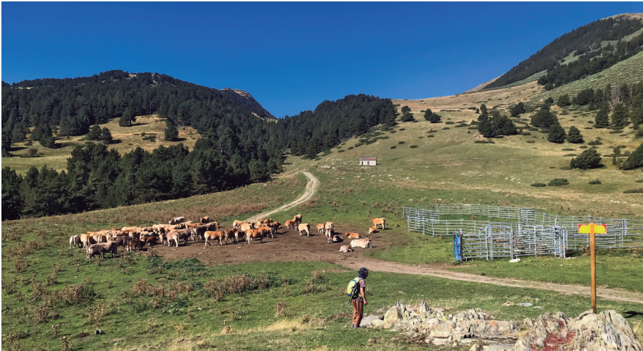
Ramat de vaques a la vora de la cleda

Un cop arribats al pla de Beret el camí és gairebé planer fins a l'aparcament d'Orri, inici i final de la caminada.