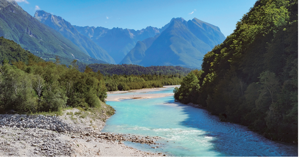
Riu Socka.

Entossudit en conèixer l'origen de tan animada colla de balladors, preguntava un cop i altre, micròfon en mà, la nostra procedència i ho proclamava als quatre vents, amb notable dificultat. En uns minuts vam passar a ser trending topic local entre la festiva audiència d'aquell concert i el públic ens saludava alegrement, al passar pel nostre davant, amb un afectuós i alhora estri-dent, "Cataluuninaa"!!!