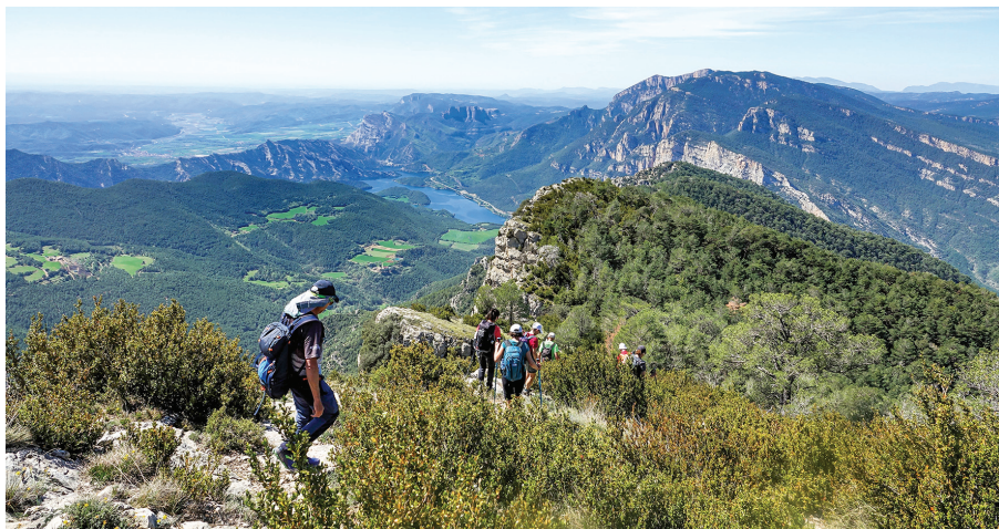
Excursió del 14 d'abril. Baixant del pic de Turp amb la serra d'Aubenc i el pantà d'Oliana al fons.