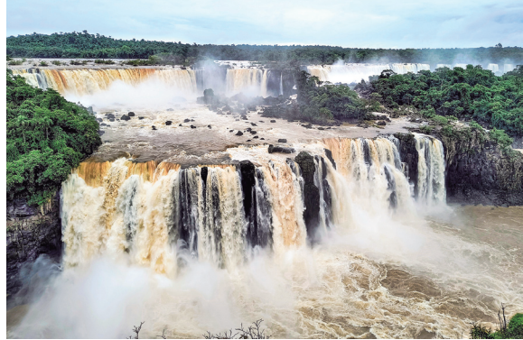
Cascades d'Iguazú.

Els dos darrers dies abans de la tornada els vam passar a Puerto Iguazú per visitar les