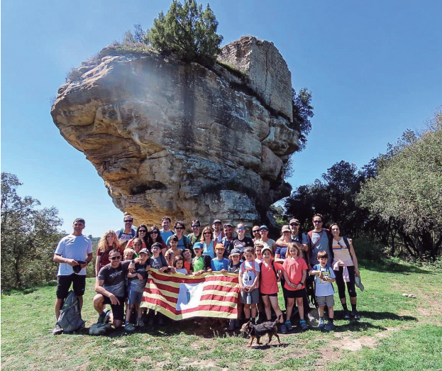
Secció Infantil.

grup i, el més important per a la SEAS, alguns dels seus membres passaven a formar part de la pròpia Junta amb voluntat de continuïtat i participació, la qual no s'ha estrocat.