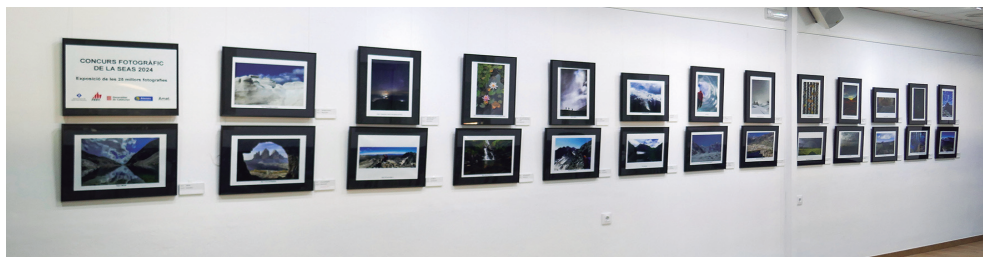
Exposició a la sala Piquet de les 25 millors fotografies del Concurs Fotogràfic de la SEAS del 2024.

Quan vaig obrir l'arxiu d'inscripcions la nit del dijous em vaig dir: Prova superada!