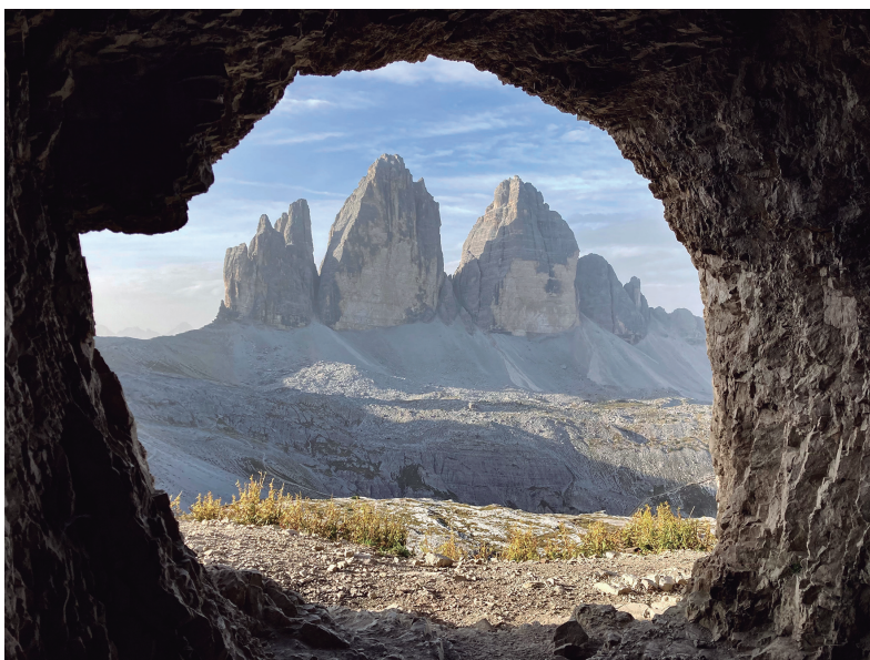
Premi a la millor foto per votació popular: «Cova privilegiada», de Maria Cortès