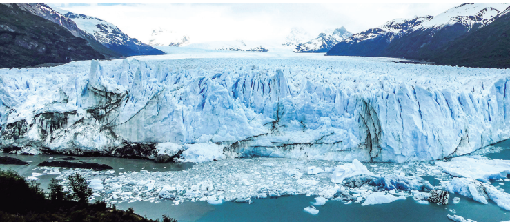
Glacera del Perito Moreno.

vertir en sis a causa de l'obligat pas per les duanes. Havíem arribat al punt àlgid del nostre viatge i teníem moltes ganes de començar el tresc pel parc nacional Torres del Paine, que havíem reservat amb molta antelació (W Exprés, autoguiat, quatre dies/tres nits).