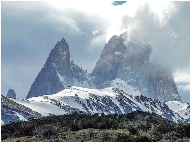
A l'esquerra la Punta Poincenot (3.002 m) i a la dreta el Fitz Roy amagat pels núvols (3.405 m).

El Chaltén és un petit poble de muntanya situat en una ampla vall glacial dins del parc nacional de Los Glaciares. Vam arribar-hi de nit i amb pluja, motiu pel qual no vam poder