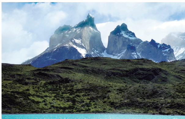
Los Cuernos del Paine des del llac Pehoé.

El dia següent, el nostre objectiu era arribar al refugi Grey, a 11 km i amb uns 300 m de desnivell. Per arribar-hi, vam tornar cap a Laguna Amarga per agafar un bus cap a Pudeto i pujar després al catamarà que ens portaria, navegant durant uns 30 minuts pel llac Pehoé, fins al refugi Paine Grande, on vam començar a caminar. Des del catamarà vam gaudir d'unes magnífiques