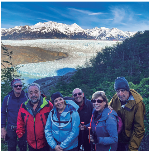
Tot el grup amb la glacera Grey al darrere.

vistes dels Cuernos del Paine, un grup de turons imponents que recorden les banyes d'un animal gegant. Vam començar la caminada per una vall estreta que ens conduiria a la llacuna Los Patos. Poc després ja vam començar a veure el gran llac Grey, que ja no perdríem de vista fins al refugi. Des del mirador situat al punt més alt de la ruta, vam poder gaudir d'unes vistes magnífiques, ben falcats per tal que el vent no se'ns emportés. Al fons vèiem el camp de gel i la llengua de la glacera Grey, que desembocava al llac amb dos fronts separats pel que semblava una illa. El camí continuava de baixada per un bosc de lengas molt frondós fins a arribar al pintoresc i acollidor refugi Grey, on vam passar la nit i vam fer augmentar notablement la mitjana d'edat dels seus hostes.