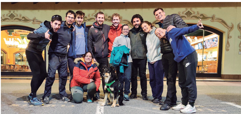
Secció Jove.

I aquesta es va materialitzar el juny de 2021 quan uns quants escoltes —que ja havien de deixar l'agrupament per l'edat— es van presentar a la Junta mostrant el seu interès per formar una Secció Jove dins de la SEAS. No cal dir que els vam rebre amb els braços oberts! Un mes després es formava aquesta secció i al setembre iniciaven l'activitat amb una primera sortida dirigida a noies i nois de 18 a 35 anys. Havia arrancat el