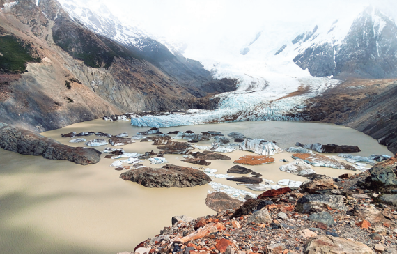
Glacera Grande des del mirador Maestri.

En arribar al campament Poincenot, la visibilitat continuava sent molt baixa i el camí cap a la llacuna de Los Tres estava cobert de neu. Per tot plegat, vam decidir no fer el tram més exposat i amb més desnivell de la ruta, i vam continuar la travessa cap a El Chaltén passant per la llacuna Capri. El temps va millorar una mica, però el cel continuava molt tapat i no vam poder tenir una vista parcial del Fitz Roy i les agulles més properes fins a la tarda, des dels carrers del poble. Arribats al nostre hotel, vam valorar amb satisfacció les dades de la nostra primera caminada: gairebé 20 km i uns 400 m de desnivell.