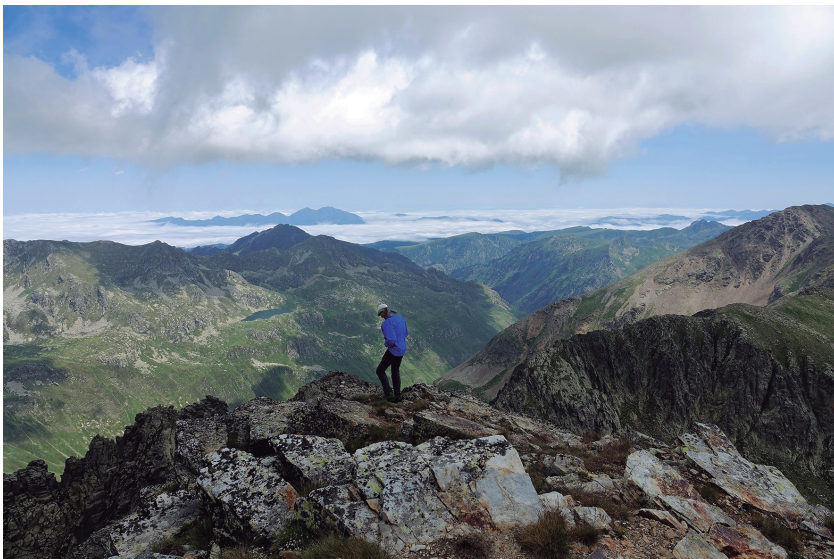
Premi a la millor foto en excursions SEAS: «Indisinerter», de Xavier Bardají