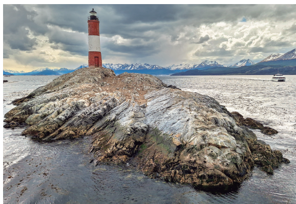
Far Les Éclaireurs, Ushuaia.

Vam arribar a Ushuaia, «la ciutat de la fi del món» i la més austral del món segons els argentins, en un vol des d'El Calafate. Aquesta bonica ciutat, capital de la regió argentina