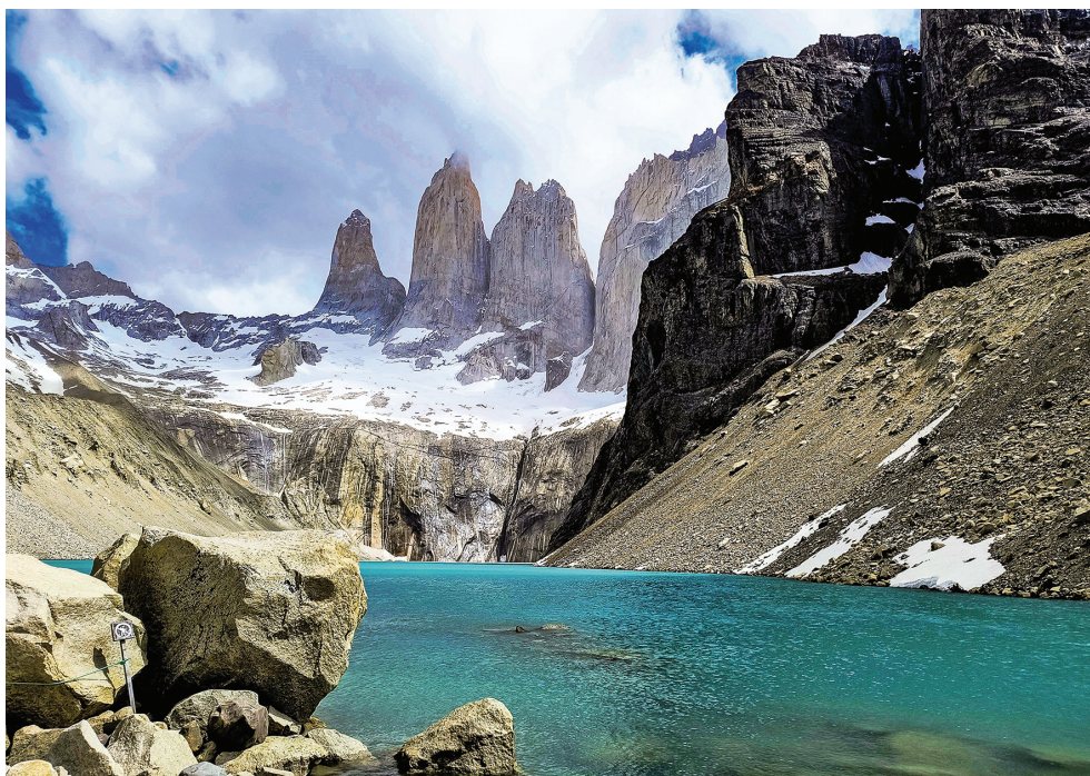
Les Torres del Paine des del mirador Base Torres, Xile.