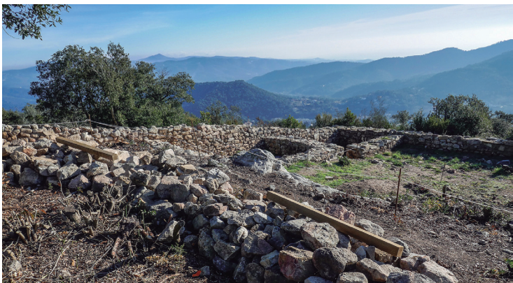
Poblat ibèric de Cèllecs

Excursió circular que iniciem al poble d'Òrrius (260 m) voltant-lo per sector nord i en direcció oest per un corriol que ens du a la pista mitjançant la qual arribarem a l'ermita romànica de Sant Bartomeu de Cabanyes, en bon estat i documentada des del 931. Cal destacar que en un pla situat al sud de l'església s'han trobat materials ceràmics ibèrics. A partir d'aquí, el recorregut