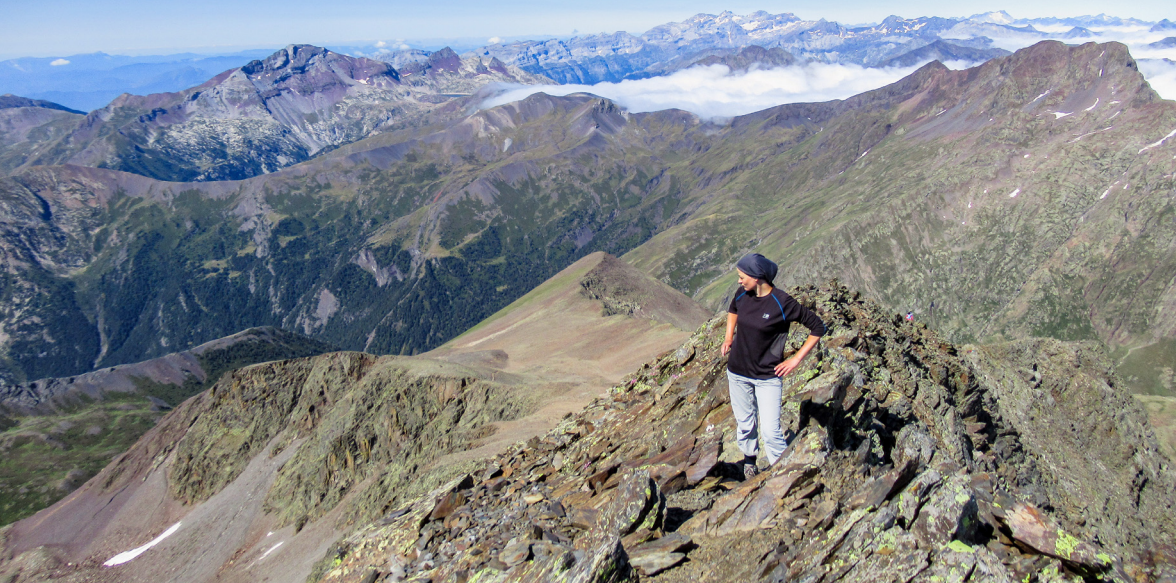
Arribant al cim del Gran Bachimala (3.177 m)